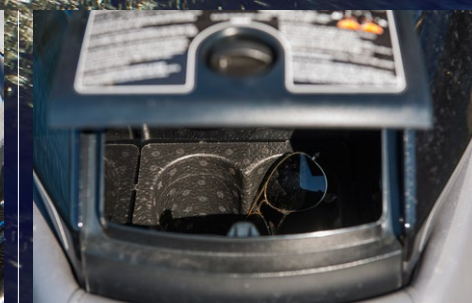
▶ Stuvfacken är många och vissa är låsningsbara.