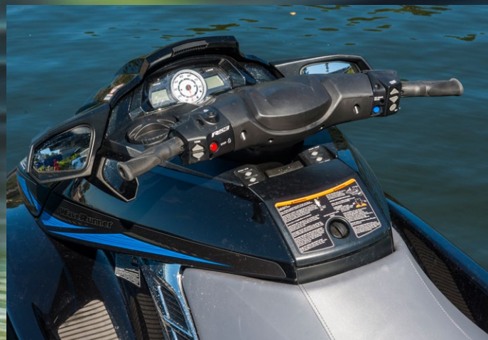
► Ride-systemet gör att du kan stå stilla på plats genom att lägga i neutralläget.

D et mörka och faktiskt riktigt eleganta skrovet blänker i höstsolen. Det är tidig morgon och både fjärd och båttrafik ligger ännu stilla. Förutsättningarna för en morgontur är perfekta. Ett snabbt tryck på fjärrkontrollen och sedan på startknappen; de 180 hästarna drar igång. Som en befriad strandad val, eller snarare pigg delfin, glider Yamahas XO HO (där HO står för High Output) ner för rampen. Skotern är försedd med Yamahas Ride-system, som är föredömligt logiskt att begripa, oavsett tidigare erfarenhet och kunskapsnivå. För att åka framåt och accelerera trycker du bara in gasreglaget på det högra handtaget. För att sakta ner eller backa drar du in spaken på vänster handtag. Har du läget i N (neutral) står du stilla, utan framåtdrift. Det är så pass lätt att jag inte kan låta bli att åka sicksack mellan några övergivna bojar. Först en gång, sedan en till och så ytterligare några gånger. Det här är busenkelt. Dessutom har Yamaha tagit fram ett system där du genom ett klick på fjärrstyrningsknappen aktiverar ett så kallat L-läge (lågt varvtal) som begränsar din topphastighet. En