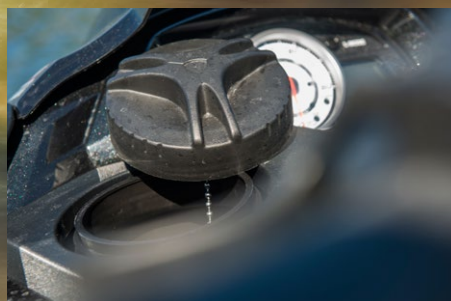
▶ Riskerar soppan ta slut förvarnas du även ljudligt.