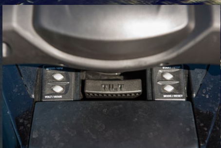
▶ Elektroniskt trimsystem ger bra koll på läget.