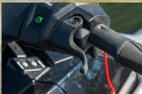
▶ Reglage, trim och övrig teknik är enkel att förstå sig på.