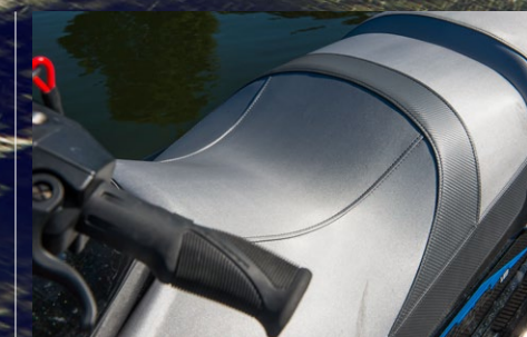
▶ Sittdynan är bekväm och rymmer tre personer.