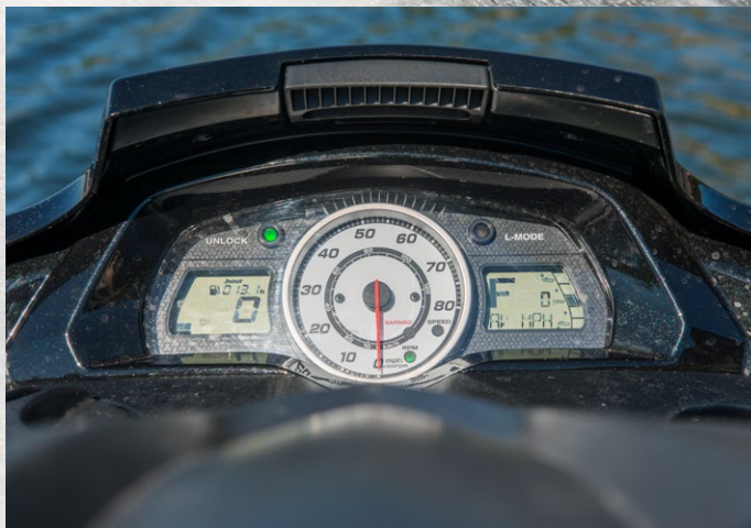
► Tydlig display och enkel manövrering underlättar både vid höga farter och för nybörjaren.