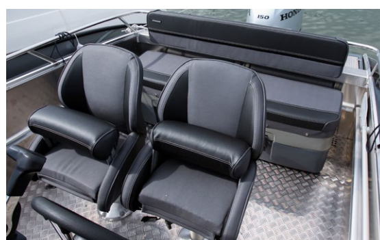
► Passagerarna i aktersoffan får stå ut med fartvind i håret.