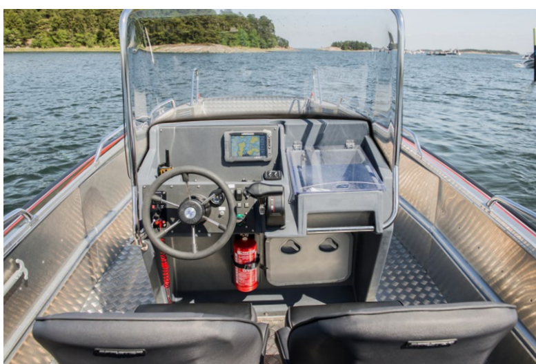
► Två personer sitter väl skyddade av rutan. Reglagen är placerade så att körningen blir bekväm.