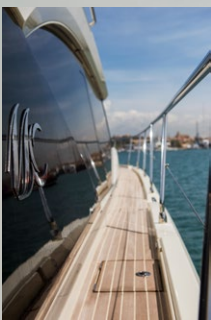
► Passagen till och från fördäck är föredömlig.

P alma visar sin soligaste och ljusaste sida. Så gör även Beneteau med sitt nya flaggskepp, Monte Carlo 6 (MC6), en 60-fots lyxyacht skapad för att falla den modernt trend- och designmedvetna båt-köparen i smaken. Med MC6 kombineras traditionell italiensk finsmakardesign med Beneteau-gruppens kunskande och vana att rodda runt stora produktioner. Målet har varit att skapa en båt värdig alla typer av farvatten, med en air av flärdfull lyx, redo att fånga nya, modiga framtidsvisionärer. Designad för cruising och lyxig komfort, precis som de mer konventionellt utformade yachterna, riktar sig ändå Monte Carlo 6 också till en ny typ av köpare. Den med självförtroende nog att göra sina egna val i form av smak sett till yachtarkitektur. Hur väl konceptet faller ut i våra svenska vatten må vara osagt. I Medelhavet, som nu utanför Mallorca, gör hon sig iögonfallande väl. Den turkosa skrovfärgen harmoniserar vackert med det lika turkosblå havet. Inramningen för premiärkörningarna av MC6 kunde knappast ha varit bättre med Palmas enorma katedral i bakgrunden och ett gäng delfiner som under vår tur lekfullt hoppar längs med skrovsidorna.