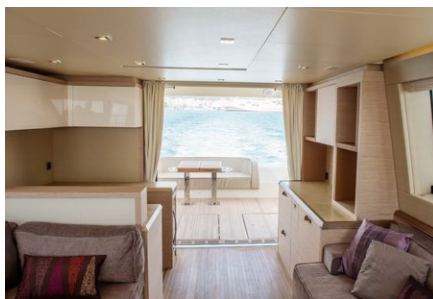
► Salongen är ljus och materialvalen håller hög klass. Här finns också gott om förvaring att stuva undan prylar.