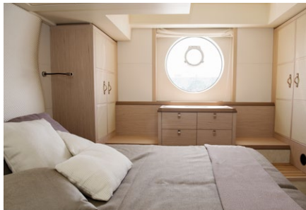
► Båtens lyxigaste kabin är placerad på babordssidan och har både egen separat dusch och toalett, samt gott om förvaring och ljusinsläpp.

Beneteau Monte Carlo 6 har en vattenlinje på 18,21 meter och en bredd på 4,90 meter. Båten drivs med ett par 600-hk Cummins QSC8,3 dieslar Zeus. Vår medföljande kapten konstaterar att maxfarten är 28 knop, men han är på bra humör och vi bestämmer oss för att se om det är ett rekord ristat i sten. Just den här dagen går vågorna höga, men vi kommer ändå upp i 29 knop och kaptenens leende växer i takt med att vi lämnar Palma bakom oss. Även om det går att plöja på denna hastighet är det knappast ekonomiskt. I den här farten går det åt drygt 181 liter i timmen och varvräknaren ligger på dryg 3070. En mer intelligent fart är cirka 18 knop. Då går båten också riktigt bra i sjön och drar cirka 135 liter i timmen. Vi börjar med att köra MC6 från den inre förarplatsen, som minst sagt är mäktigt och redo att rymma även de största direktörsmargar. Förarstolen är i det närmaste magnifik, en bred, brun läderfåtölj med reglage för att styra navigatören på ena armstödet och en joystick för att manövrera båten på det andra. Det är liksom bara att slå sig ner, luta sig bekvämt tillbaka och köra. Förarplatsen är placerad centralt i båten, om styrbord finns en bredare och mycket bekväm passagerarsoffa med plats för minst två personer.