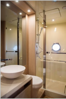
► Monte Carlo 6 har flera wc- duschutrymmen. Alla lika ljust inredda.