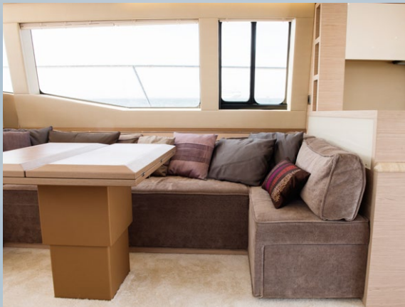
► Socialiseringsyta. Invändigt bjuder MC6 på generösa umgängesutrymmen. Strax akter om soffgruppen ligger köket.

Solen skiner och det gör nästan ont i en svensk själ att sitta inomhus, så vi klättrar upp för den breda trappan på styrbords sida och kopplar över driften till förarplatsen på flybridge. En flybridge som är ovanligt stor för klassen. Den kraftiga vinden och båtens höjd gör att det fläktar rejält här uppe, med det skyddande binimitaket gör sitt jobb väl. På flybridge, som består av en stor solbädd och en U-formad soffa runt ett pelarbord i massivt trä, ryms tio personer. Precis bakom förarplatsen finns en avdelning som tillåter förberedelse av diverse förfriskningar. Intill förarplatsen finns även en mindre lounge som gör att passagerarna sitter vända framåt och kan njuta av samma syn som föraren. Faktum är att man sitter som en havets drottning/kung här uppe. Det är nästan en känsla av att sväva bland molnen. Känslan går igen i flera avseenden. Här finns all lyx man kan tänkas behöva, från vin- och champagnekyl till disk- och tvätt-