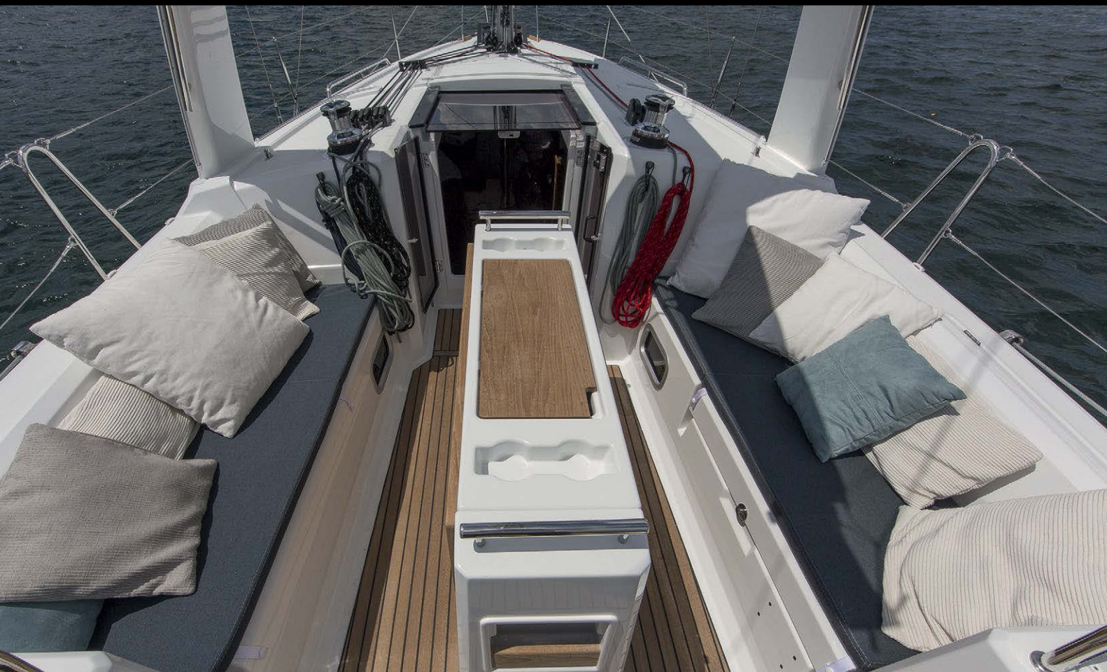
KUDDHAV. Om det fasta de luxe-bordet köps till får man sällskaplighet och komfort i tiden i den rymliga sittbrunnen. Kuddar och dynor visar hur avspänt och lyxigt varvet tänker sig seglarlivet i solen på en modern 35-fots familjebåt.