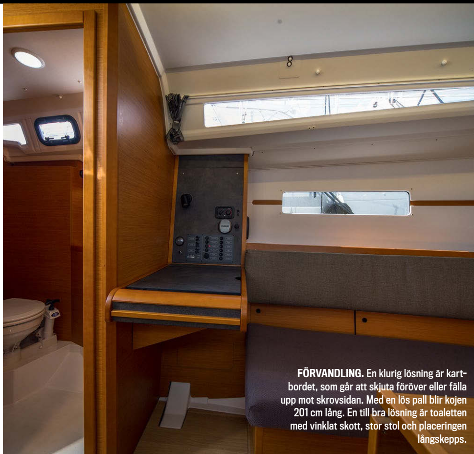
FÖRVÄNDLING. En klurig lösning är kartbordet, som går att skjuta föröver eller fälla upp mot skrovsidan. Med en lös pall blir kojens 201 cm lång. En till bra lösning är toaletten med vinklat skott, stor stol och placeringen längskepps.