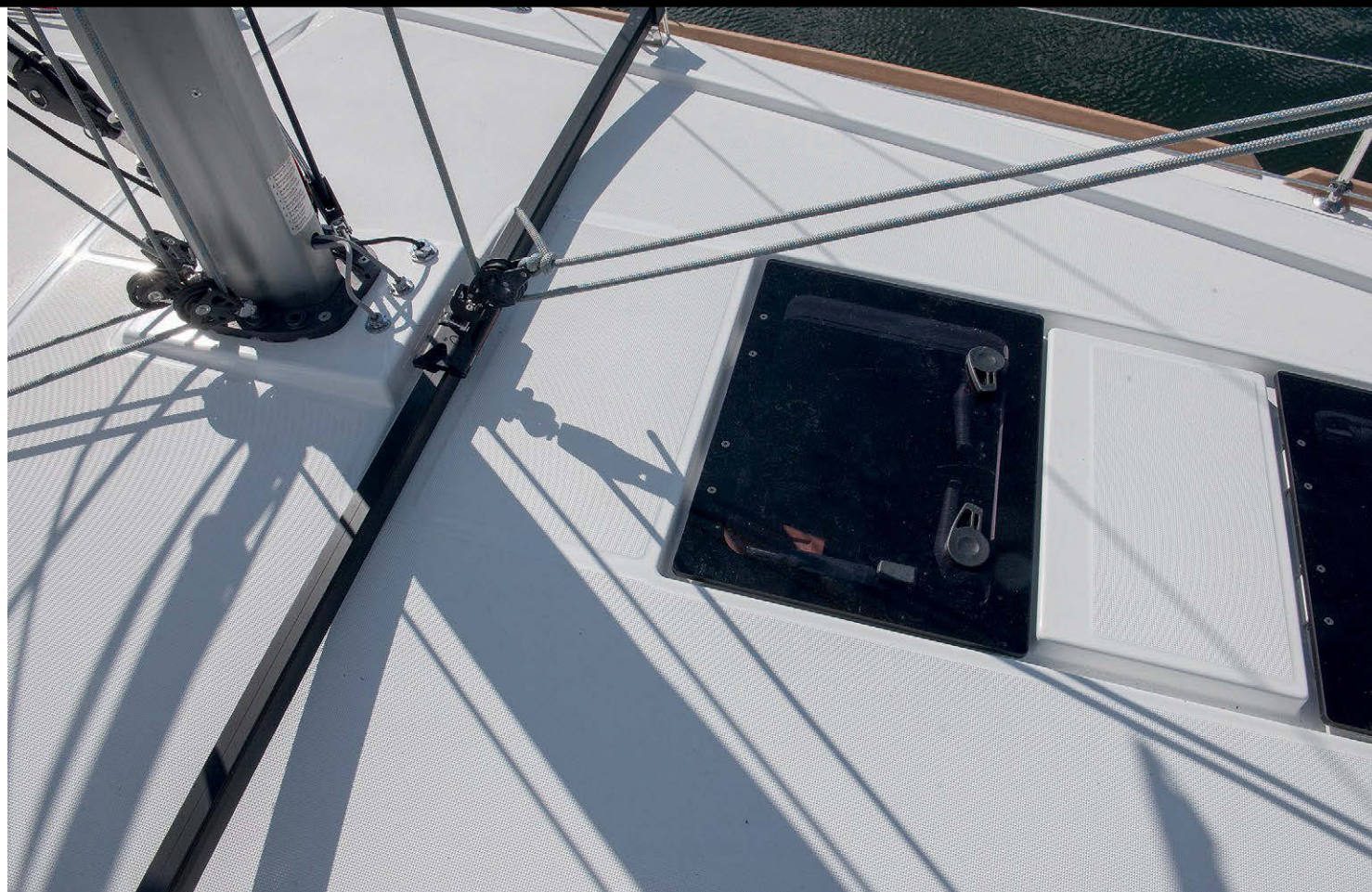
SKENMANÖVER. Enkel segling ligger i tiden och som tillval finns därför selftacker. Här har skenan gjorts rätt med god dimension, korrekt böjning och utväxling till skotet. Det goda är att seglet inte fastnar om det skotas hårt. De flushmonterade luckorna är eleganta och praktiska, då inga skot fastnar.

på undervanten är nackdelen. En god nyhet är att Beneteau följer strömmen och erbjuder selftacker. Testbåten hade denna lösning, som tillät djärva, snäva slag nära land närhelst rorsman ville. Som standard har Oceanis 35 fock och skena med justerbar travare.