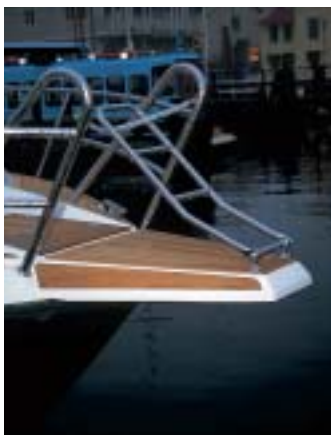
En smart stävstege från peket underlättar.

Det som förtjänar att framhållas extra på den här nästan perfekta båten är det enormt stora och lättarbetade motorrummet. Det snygga träarbetet i mörk mahogny. De genomarbetade och många fina detaljerna. Den låga ljudnivån. De goda, stabila sjöegenskaperna. Den går stadigt och tungt utan minsta stamp i sjöarna. Gör bra fart, 34 knop på topp, trots att båten är tio ton tung. ■