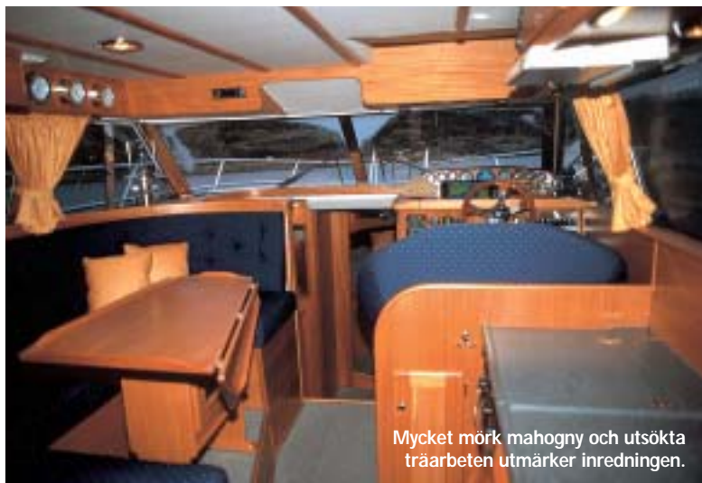
Mycket mörk mahogny och utsökta träarbeten utmärker inredningen.