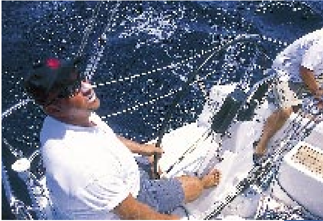
Till rors sitter man utmärkt med ratten, skotet och travaren inom räckhåll. Den breda sargkanten i kombination med fotstödet gör också sitt till för bekvämligheten.

den ska bli framgångsrik i snåriga skärgårdar.