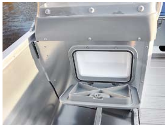
Smart litet stuv i styrpulpeten.

Jag skulle personligen välja det största alternativet, 30 hk, då det finns mer kraft när man lastar båten full med folk, fiskeutrustning eller åker vattenskidor. ●