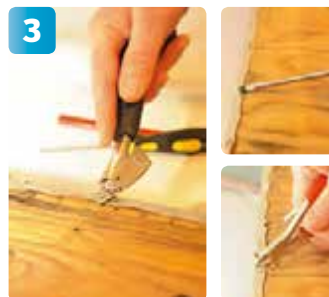
Plocka bort alla gamla häftklamrar. Det finns ett specialverktyg, men en vanlig skruvmejsel fungerar nästan lika bra. Om klamrarna går sönder kan en avbitartång komma till användning.