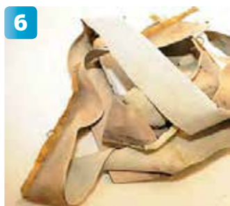
Vitsen med att klippa sönder den gamla klädseln i sömmarna är att delarna ska användas som mallar för den nya klädseln. Men i detta fall är kantbiten så pass trasig att den förpassas till papperskorgen.