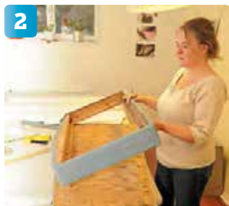
Alla skruvar är urskruvade och sockeln kan separeras från sittdynans underrede.