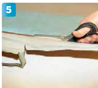
Klipp loss kantbiten. Låt saxen löpa så nära kederlisten som möjligt. Notera var den söm som sammanfogat den gamla kantbiten varit placerad. I vårt fall har den legat delvis dold av ryggdynan.