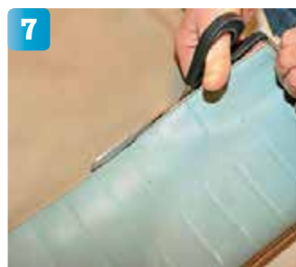
Fortsätt på den inslagna vägen med saxen. Dela upp sittdynans tre ursprungliga paneler för att kunna använda dem som mallar.