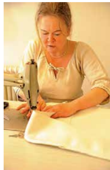
En bra symaskin och en portion tålmod är två viktiga faktorer för ett lyckat slutresultat.

– Det uppstår alltid blodvite vid den här typen av jobb. Alltid, säger hon och skrattar.