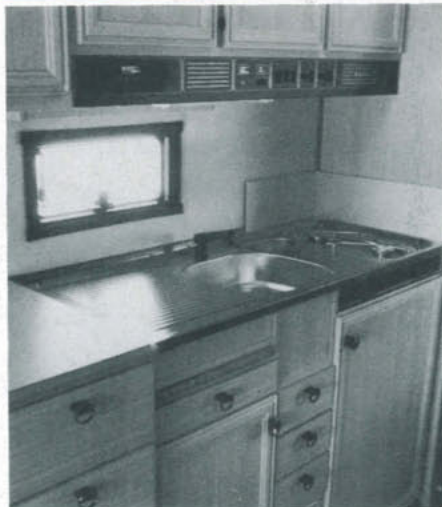
Det stora köket fungerar bra och förvaringsmöjligheterna är goda. Praktisk finess är den lilla slaskratten mellan diskhon och spisen.