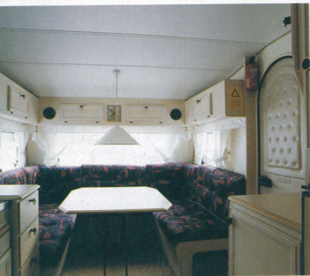
Samvarodelen finns i vagnens främre del, omedelbart intill entrédörren.