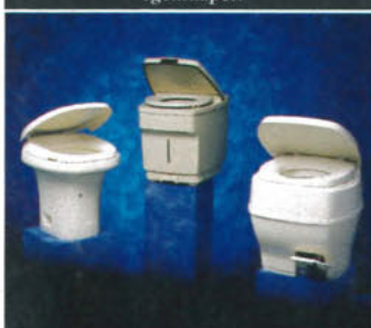
THETFORD AQUA MAGIC OCH ELECTRA MAGIC - PERMANENTA TOALETTER