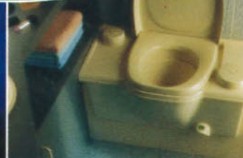
THETFORD CASSETTE PORTA POTTI Integrerat toalettsystem med en bärbär avfallstank som kan tas ut från utsidan.