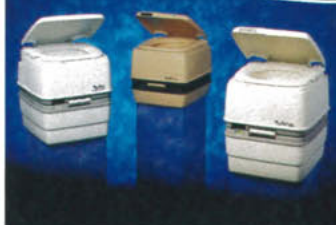
THETFORD PORTA POTTI En serie barbara och löstagbara toaletter med varierande kapacitet, färger och egenskaper.