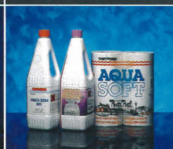
THETFORD AQUA PRODUKTER Aqua Kem Bio Saneringsvätska, Aqua Rinse Spolvattentillsats och Aqua Soft Toalettpapper.

THETFORD ÄR VÄRLDENS LEDANDE TILLVERKARE AV MOBILA TOALETTSYSTEM. VI HAR MEDVETET SATSAT PÅ PRODUKTUTVECKLING FÖR ATT GE VÅRA PRODUKTER HÖG KVALITET OCH LÅNG LIVSLÄNGD. VI HAR ETT BRETT SORTIMENT AV TOALETTER MED FÄRSKVATTENSPOLNING SOM PASSAR ALLA TYPER OCH STORLEKAR AV HUSVAGNAR, HUSBILAR, CAMPINGVAGNAR OCH BÅTAR. SORTIMENTET OMFATTAR PORTA POTTI, CASSETTE PORTA POTTI, AQUA MAGIC OCH ELECTRA MAGIC. OCH SÅ FINNS THETFORDS AQUA-PRODUKTER MED FLERA TYPER AV SANERINGSVÄTSKOR OCH TOALETTPAPPER, SOM FÖRSÄKRAR EFFEKTIV ANVÄNDNING OCH LÅNG LIVSLÄNGD. DESSUTOM ERBJUDER THETFORDS INTERNATIONELLA SERVICENÄTVERK EN UNIKT HÖG SERVICEGRAD.