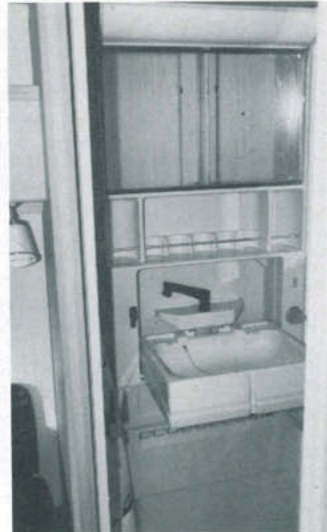
Tvätttrummet har generösa mått, och det uppfällbara tvättstället är praktiskt.

fullt tillfredsställande, varför det inte bör uppstå några problem ens under varma somrardagar. Och åker man söderut, där hettan kan bli stor, har man ju normalt inte förtältet stängt, så inte ens då bedömer vi att det inte ska gå att hålla mat och dryck kylda.