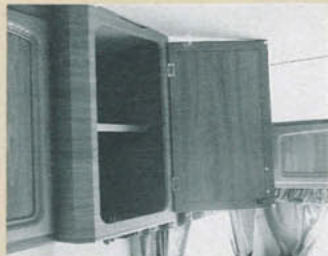
Redan vid ett tidigare test har vi konstaterat, att den här köks-ovanskåpluckan skrapar i taket.

Ja, gott betyg blir det över huvudet taget för värmeinstallationen i vagnen. Värmejämnheten är