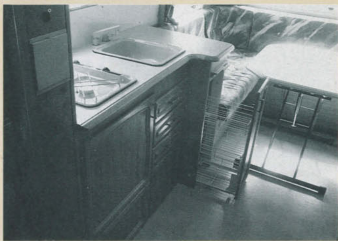
Köket är rymligt och arbets- och avställningsytorna tillräckliga. Praktisk detalj är den utdragbara trådbackställningen i kökets vinkeldel.

mycket god i hela vagnen, och att golvvärme är standard – även i tvättrummet – är ett stort plus. Tråkigt bara att Sävsjö, som så många andra, valt en elektrisk golvvärme som alltså inte fungerar utan tillgång till nätanledning.