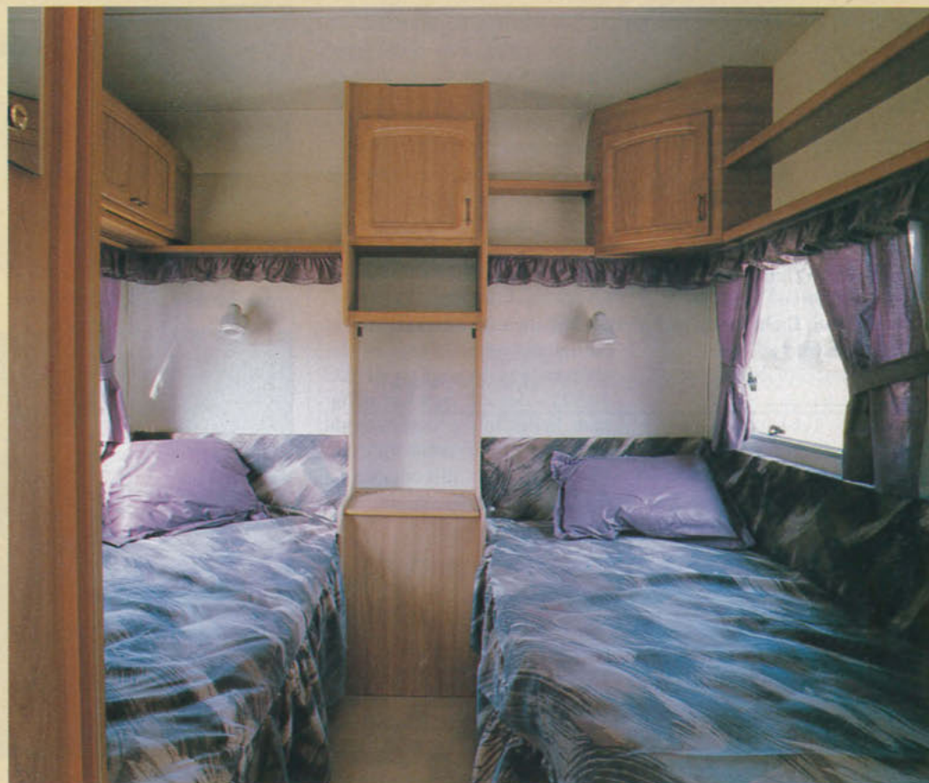
"Sovrummet" är försett med två fasta långbäddar. Skönt, att alltid ha sängen stående färdig!

finns ett högskåp innehållande ett skåp, en hylla och ett fack för exempelvis make-up-grejer – ungefär som i forna tiders sängkammarmöblemangs så populära sminkbord. Men utrymmet under detta fack är helt outnyttjat!