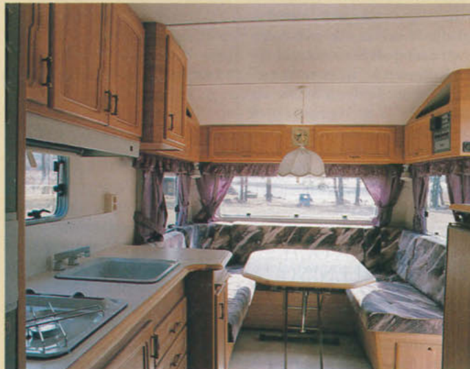
I vagnens främre del finns en rundsittgrupp med god komfort. Gavelsoffan lämpar sig dock bäst för kortare personer.

□ När det gäller skåpet längst till höger, ovanför den utskjutande vinkeldelen, så konstaterade vi redan förra gången vi testade en Euroline-vagn att skåpluckan skrapade i taket när man öppnade den helt. Så är