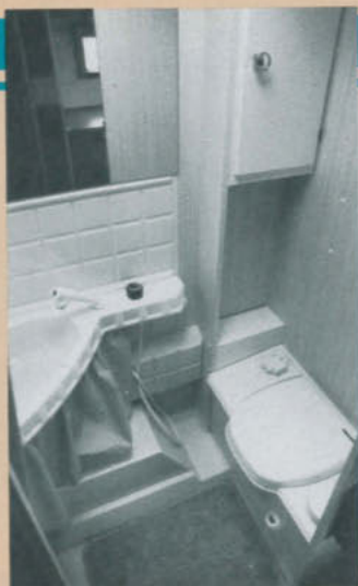
Tvätttrummet är rymligt, och stora spegelytor gör det ännu luftigare.

□ Golvet är för övrigt utformat som ett duschkar, och eftersom man kostar på sig en separat termostatblandare för duschhandtaget så är det både skönt och vattensnålt att duscha. Ventilation får man via en taklucka, men vi hade gärna sett att luftin-