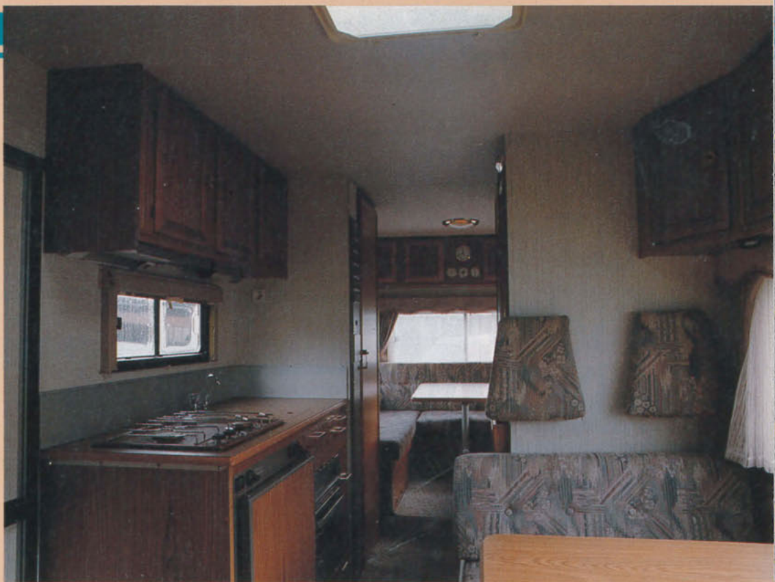
Inredningen i teak är typisk för Bjölseth.

också påpeka, att den bakre ryggdynan, som inte används vid bäddningen, är synnerligen utrymmeskrävande. Värt att lägga märke till är också, att delningen på dynorna i rundsittgruppen är sådan, att det blir onödigtvis besvärligt att inifrån bilen komma åt det som förvaras i lastutrymmet.