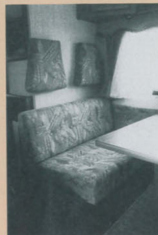
Sittkomforten i dinetten är mycket god, men nackskydden sitter för lågt monterade. Natte-tid går det att få en helt plan bädd.

Denna har kompletterats med elektrisk golvvärme i större delen av bilen – inklusive tvätttrummet – men saknas under rundsittgruppen.