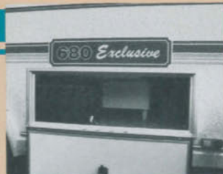
Det utifrån åtkomliga lastutrymmet är synnerligen stort. Där sitter dessutom avloppstanken monterad. Men var ska man ha sängutrustningen om man vill använda även rundsittgruppen som sovplats?

Som alla andra nordiska husbilar, har Bjölseth 680 Exclusive vattenburen centralvärme.