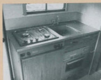
Köksbänken är stor, och om man inte behöver använda diskhon finns det gott om arbets- och avställningsytor. Men eftersom både kylskåp och ugn är monterade i bänken, blir förvaringsutrymmena minimala.

släppet i tvätttrummet varit något bättre. Då hade man sluppit all kondensfukt på speglarna. □ En lite "udda" finess, som vi dock sett tidigare i en del andra husbilar, är att en liten länsypump transporterar duschvattnet till den inbyggda tanken då man inte vill släppa ut det direkt på marken.