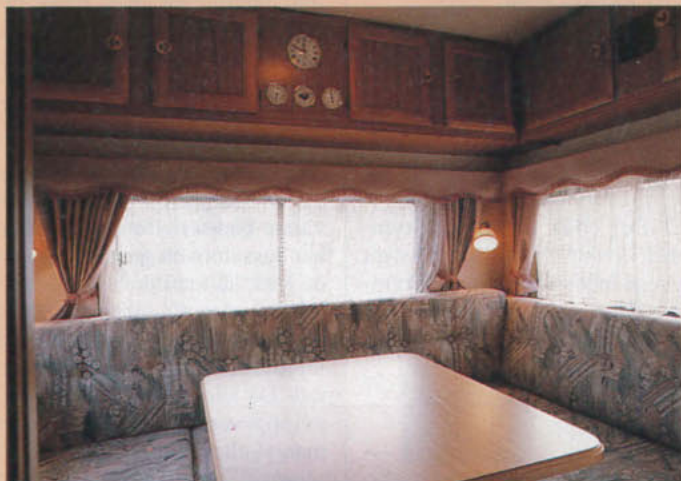
Längst bak i bilen finns en separat "kajuta" – avskiljning i form av dörr eller draperi saknas dock – med en rundsittgrupp.

Ovanför mittdinnetten finns fem ovanskåp, och ovanför rundsitt-