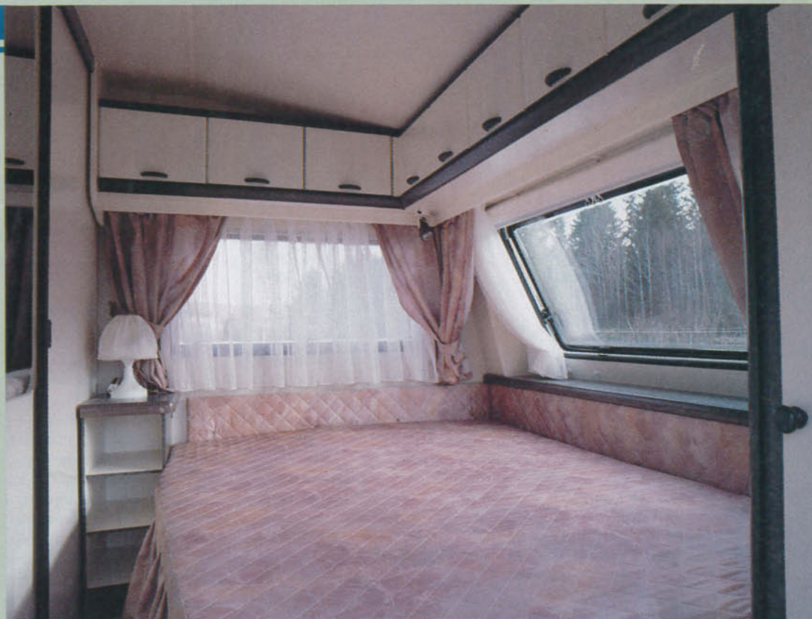
I vagnens främre del finns föräldrasovrummet med sin fasta dubbelsäng och separata garderob.

□ Även här finns ett högt fönster i höger sidovägg, och värmeinstallationen under detta