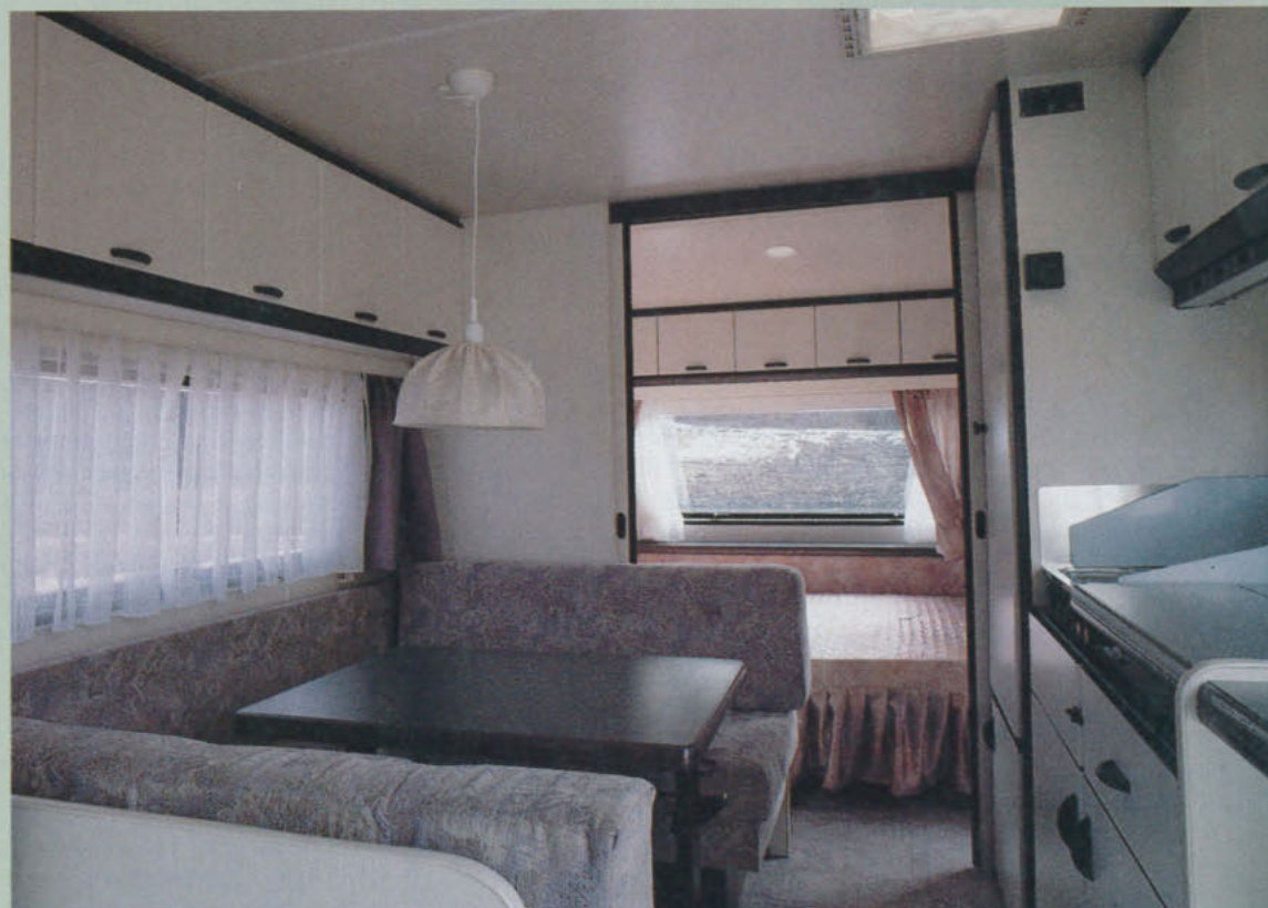
Vagnen är ljus och öppen, och sittgruppen i mitten inbjudande. Sittdjupet är dock i minsta laget.

fönster är lika undermålig som i vagnens främre del.