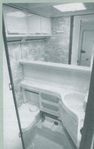
Tvätttrummet är ljust och härligt, och fungerar bra.

också en liten avrinningsbricka – dock utan eget avlopp – för exempelvis grönsaker.