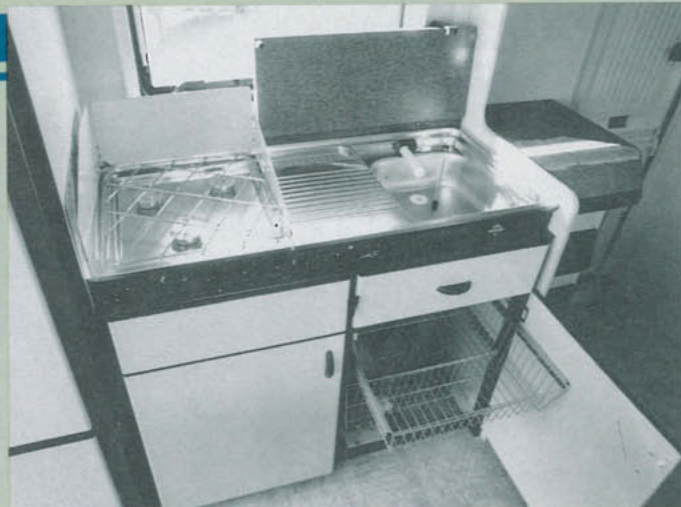
Köksbänken är av normal tysk typ. Utdragsbackarna i underskåpet är praktiska.

□ Ovanför de båda tidigare nämnda garderoberna i sovrummen finns små praktiska skåp.