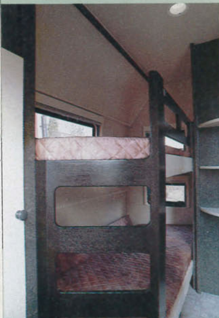
Bakom finns en barnkammare med väningsäng. Även här finns en garderob och praktiska förvaringshyllor.