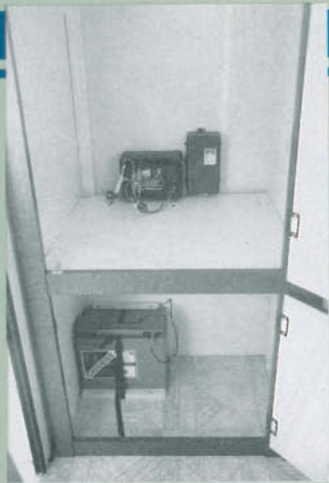
Batteriladdaren stjälar onödiga plats i garderoben, och batteriet är oskyddat monterat i skåpet under till. Kritik blir det också för 12 V-installationen, med endast två – mycket kraftiga – säkringar.