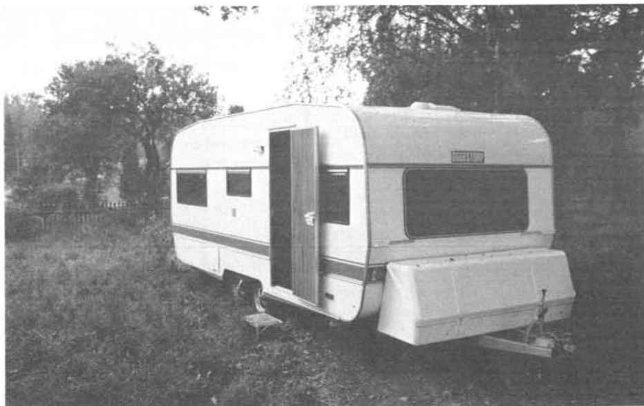
Formen är funktionell och harmonisk – så här ska en husvagn se ut, tycker många. Vi gillar den vagnsbreda kofferten som ger extra stuvutrymme. Men varför inte en infällbar trappa i stället för "trädkorgen"?

dat hörn in mot sittgruppen. En kant skulle inte skada så att man minskar spillrisken.