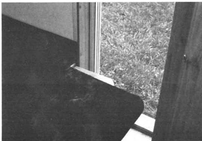
Mindre praktisk är bäddningen av rundsittgruppen. Större delen av dörröppningen spärras, och hörndynan vill inte ligga kvar på plats.

let blir man hänvisad till campingplatsernas (inte alltid så rena) hygienanläggningar.