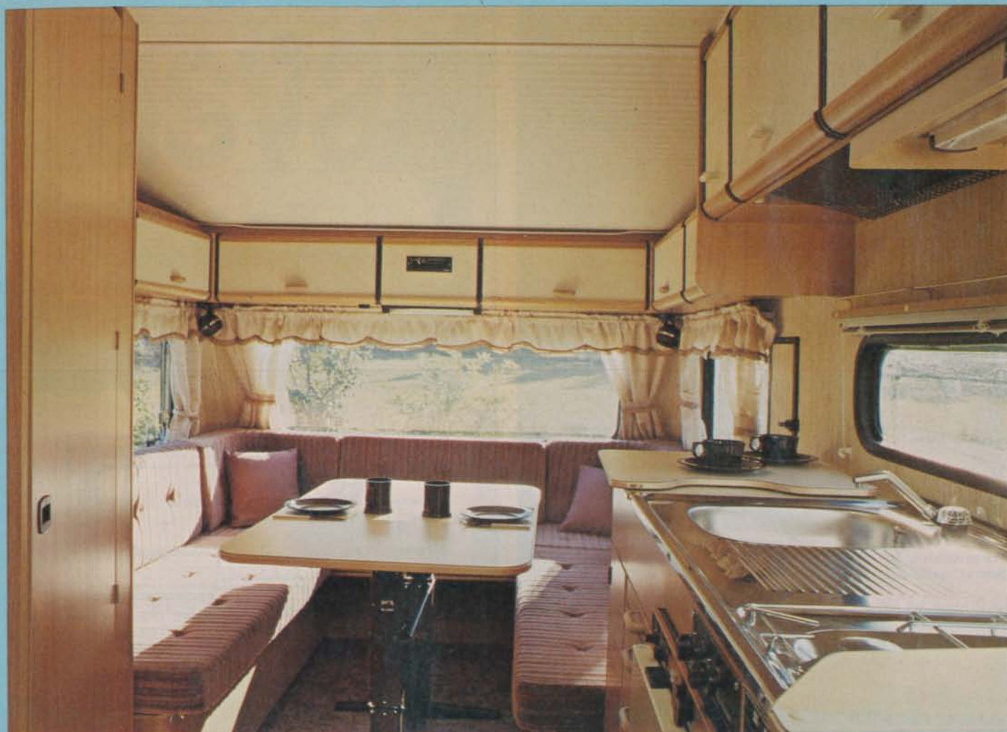
Den ljusa inredningen i Solifers Artic-vagnar tilltalar många.

kan dock användas även som skärmvägg mot ytterdörren, och på så sätt torde en stor del av kalldraget elimineras.