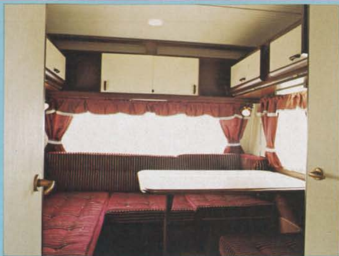
Den bakre gruppen är ändrad inför -87. Kombinerade ovanskåp/bäddar är nu standard på båda sidor, och dessutom har hela gruppen spegelvänts.

skattas av många. Kvar står dock det faktum, att det känns lite trångt i tvätttrummet med dörren helt stängd – något som är aktuellt då det t ex är dags att använda toaletten och som krävs om man vill ta en dusch. Och duscha kan man faktiskt göra i den här vagnen, mycket tack vare att hela golvet är utformat som ett duschkar, som dessutom går en bit upp på vägarna.