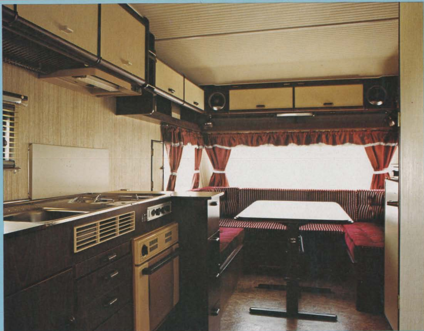
Inredningen i Solifers Finlandia-modell skiljer sig från de flesta andra husvagnar. Mörka snickerier och ljusa skåpluckor ger ett intryck av lyx, mer än av en rullande sommarstuga.

"D en andas kvalitet" skrev vi som rubrik när vi senast testade en Finlandia-vagn – modell 2002 i februari 1985 – och det omdömet gäller lika mycket för den nu testade 3002-vagnen, och då speciellt i 1987 års tappning.