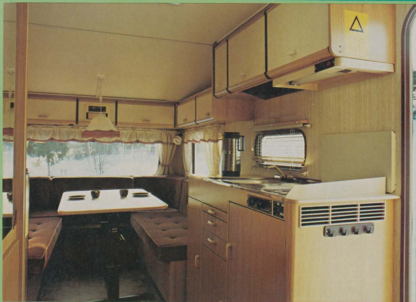
Interiören är finländskt ljus och luftig. Valet av textilier tyckte dessutom de flesta i testgruppen var mycket smakfullt.

arbetad, även om inte den rostfria skivan med diskho och spis är av den allra mest lättstädade sorten.