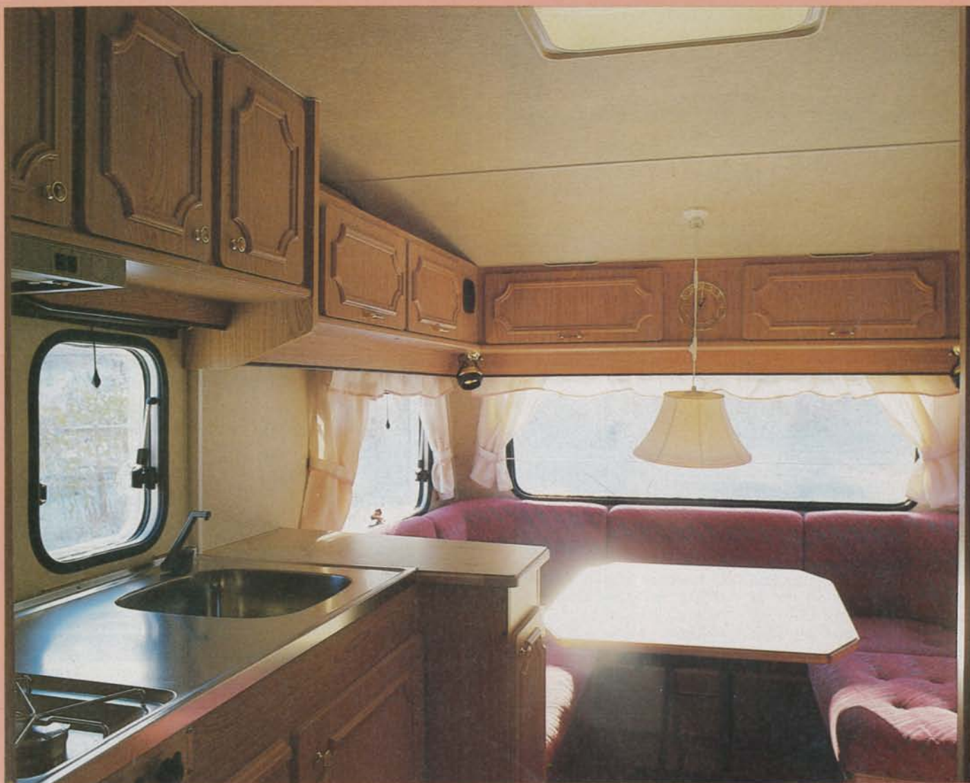
Inför modellåret -88 har den kontinentalt präglade interiören i Smålandia-vagnarna mjukats upp, med bland annat rundade hörn på alla luckor. Rundsittgruppen i vagnens främre del är mindre än i föregångaren 560, men räcker ändå gott till.

tröjor, underkläder och annat lätt fastnar och får "noppor".