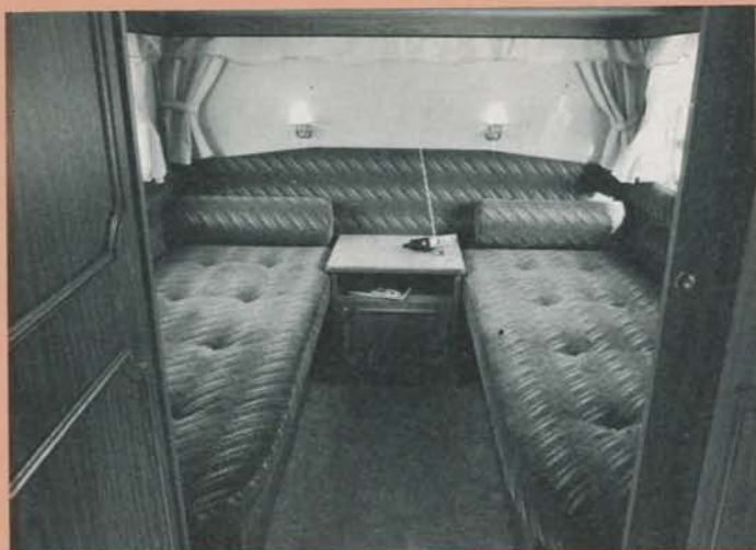
I vagnens bakre del finns ett separat sovrum, åtskiljbart med ett par skjuddörrar. Skönt att inte behöva bädda upp för att kunna äta frukost!

taljer vi anmärkte på senast vi testade Smålandias största modell, och det har inte förändrats nämnvärt på -88 års upplaga.