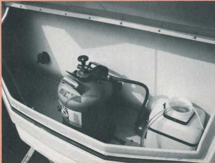
Tyvärr är det endast plats för en 11-kilos gasolflaska i kofferten. Positivt är dock, att det finns hållare för reservhjul som standard.

att man utan problem kan sköta sin hygien – även tvätta sig under armarna – i det. Tvättstället är dock osedvanligt lågt placerat.