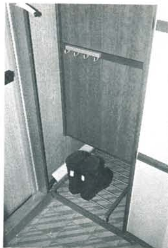
Direkt innanför dörren finns en praktisk garderob, som även fungerar som torkskåp.