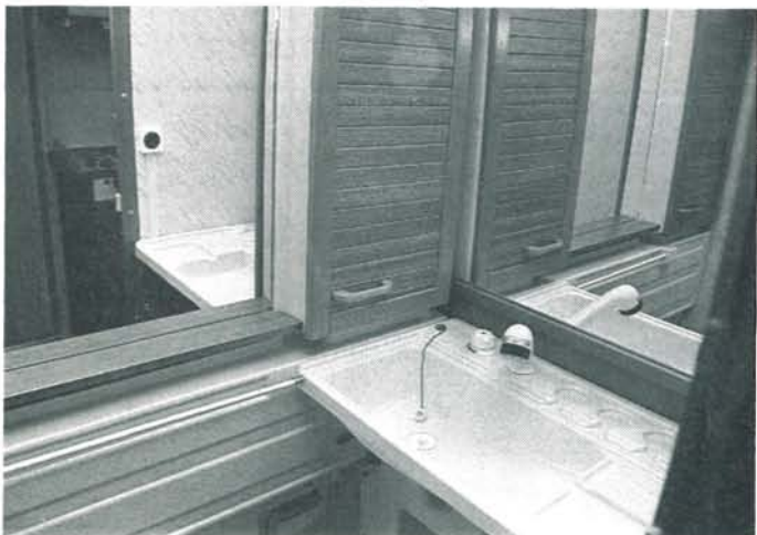
Tvätttrummet är helt nydesignat, och väl fungerande. Möjlighet finns att komplettera med kassett-toa.

och dusch. Även en vattenblandare (dock ej termostatblandare) finns som standard. (En bättre, och vattenbesparande, lösning hade dock varit en riktig termostatblandare, kombinerad med ett duschhandtag med "avtryckare".) Efter komplettering med varmvattenberedare, och översyn av tätningen mellan väggar och golv (eller varför inte låta sätta upp ett duschdraperi), är det alltså fullt möjligt att ta en dusch i vagnen.