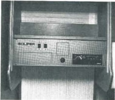
Manöverpanelen innehåller det nödvändigaste, och det är lätt att komplettera med exempelvis radio i efterhand.