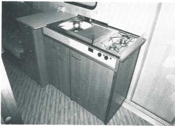
Vinkelköket är rymligt och lättarbetat.