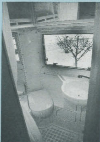
Tvätttrummet är mycket stort och luftigt, men fönstret borde vara opaliserat. Dessutom skulle man föredra en taklucka.