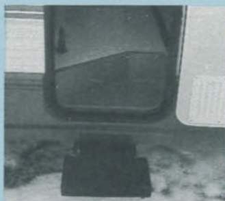
Vid bo-delens insteg finns ett lätt utfällbart trappsteg. En summer varnar dessutom, om man startar bilen med fotsteget ute.