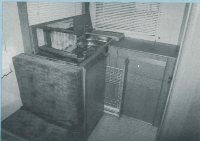
Den fällbara luckan över kök och diskho borde tas bort, och dessutom borde det finnas en bättre plats för bestick och liknande än den "ho" som nu finns. Pluspoäng för det utdragbara skafferiet!

Genom att alkobädden kan fällas ihop, blir förarplatsen ljus och luftig. Dessutom förbättras genomgången mellan förarhytt och bo-del.