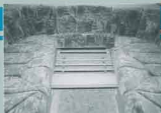
Vid bäddningen av de båda sittgrupperna dras en ribbotten ut mellan sofforna. Enkelt och bekvämt!