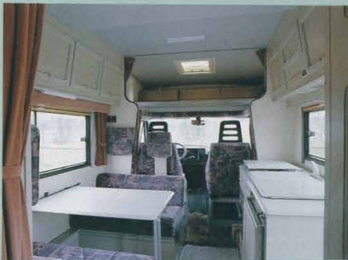
Den främre sittgruppen har plats för fyra åkande, och kontakten mellan gruppen och förarhytten är god.

□ Men förarhyttens tak är uppskuret, och botten till alkovbädden är tvådelad, och när dessa delar läggs ovanpå va-