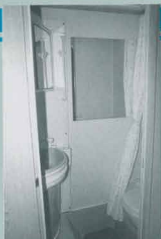
Gott om plats är det i tvättrummet, trots att måtten inte är de allra största.