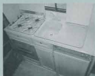
Köket är stort och – tack vare de fällbara locken över spis och diskho – relativt lättarbetat.