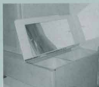
Vid rundsittgruppen finns ett sminkbord, som även kan användas som TV-bänk.

skåpet – ett Electrolux RM 2291 på 88 liter – sin plats. Kylskåpet är försedd med utvändigt ventilation, och eftersom Swift numera använder Electrolux egen ventilationssats är risken liten att kylskåpet inte ska kunna fungera optimalt även när uttemperaturen är hög.