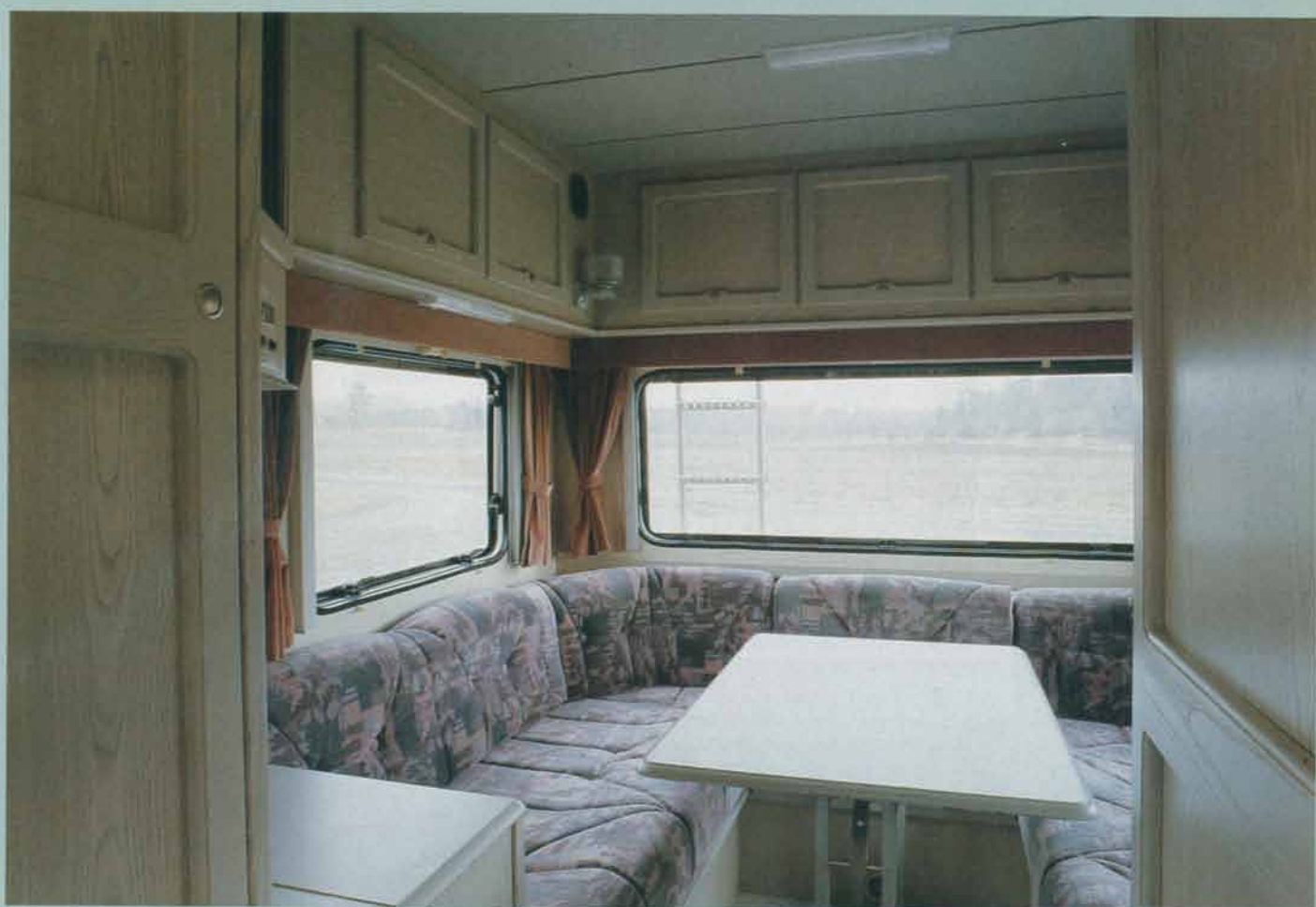
I bilens bakre del finns en rymlig rundsittgrupp, där hela familjen kan få plats.

mellan köksbänken och förarhytten, och en ribbotten dras ut mellan de båda sofforna. Mycket fiffigt och bekvämt!