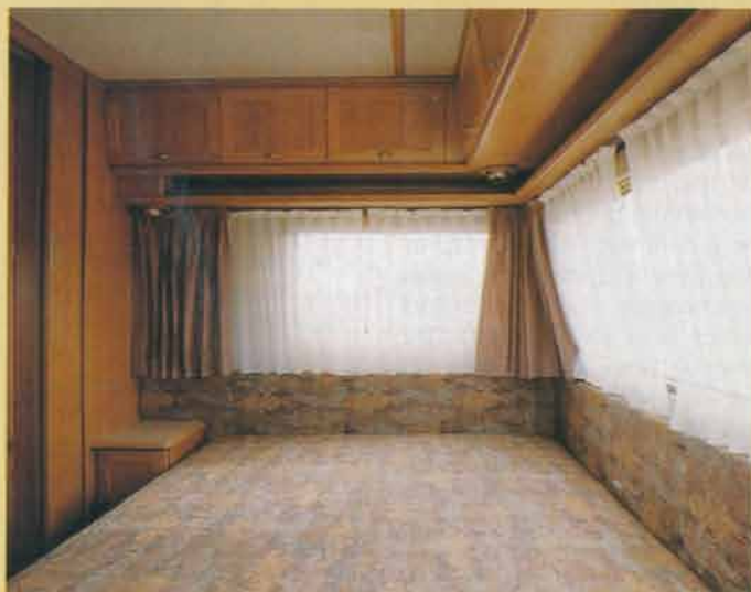
I vagnens bakre del finns ett avskiljbart sovrum.

□ Mindre bra är däremot förvaringsutrymmena i köksbänken. I den lilla vinkeldelen finns förvisso en utdragbar trädställning, men denna är så konstruerad att den är svår att utnyttja