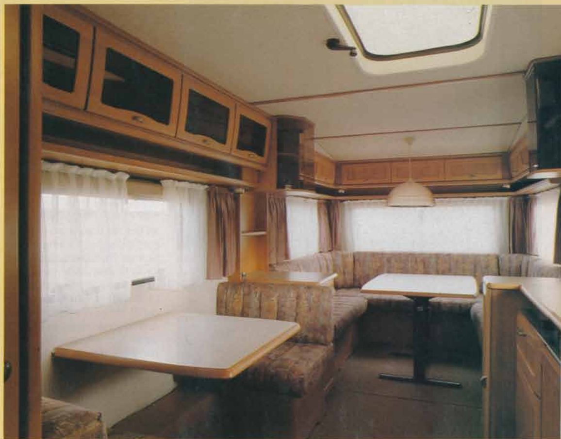
Rundsittgrupp och mittdinetten ger gott om sittplatser.

Längst bak i vagnen finns en imponerande, tvärställd dubbelsäng med 145 centimeters bredd. Ett problem kan det kan-