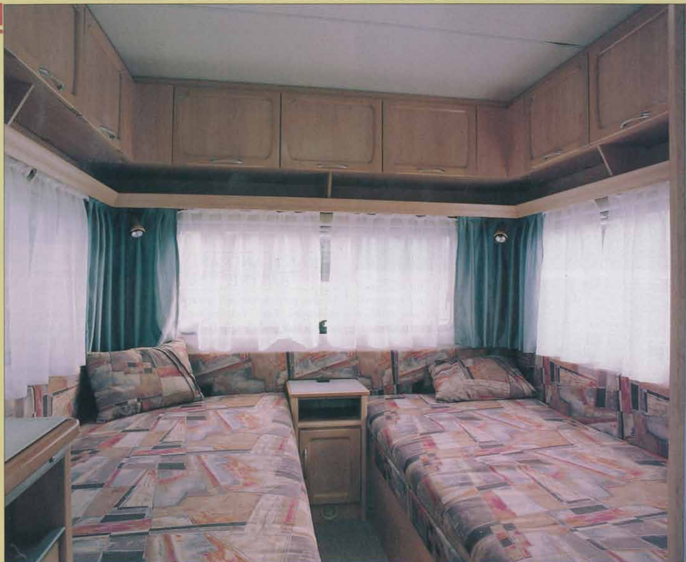
Två rejält breda sängar finns det baktill i vagnen, men längden är det sämre beställt med – 178 respektive 188 centimeter.

sällan man kommer att bädda i sittgruppen.)