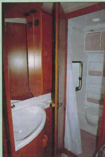
Tvättstället finns inne i sovrumbet, och duschutrymmet – inklusive kassett-toilet – döljer sig bakom en dörr.

Halva utrymmet under den rostfria bänken upptas av kylskåpet – ett Electrolux RM 301 på 87 liter, medan den andra halvan rymmer ett skåp med praktiska trädbackar samt en besticklåda.