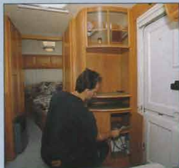
Tevehyllan är placerad i skåpet innanför dörren. Dörren är tvådelad och är försedd med mygg-nätsgardin.

anslutning till köket. Köksfläkt är standard liksom ett väl tilltaget öppningsbart köksfönster. Under kvällstid gör kökets lysrörslampa ett bra jobb med att lysa upp diskbänk och spis.