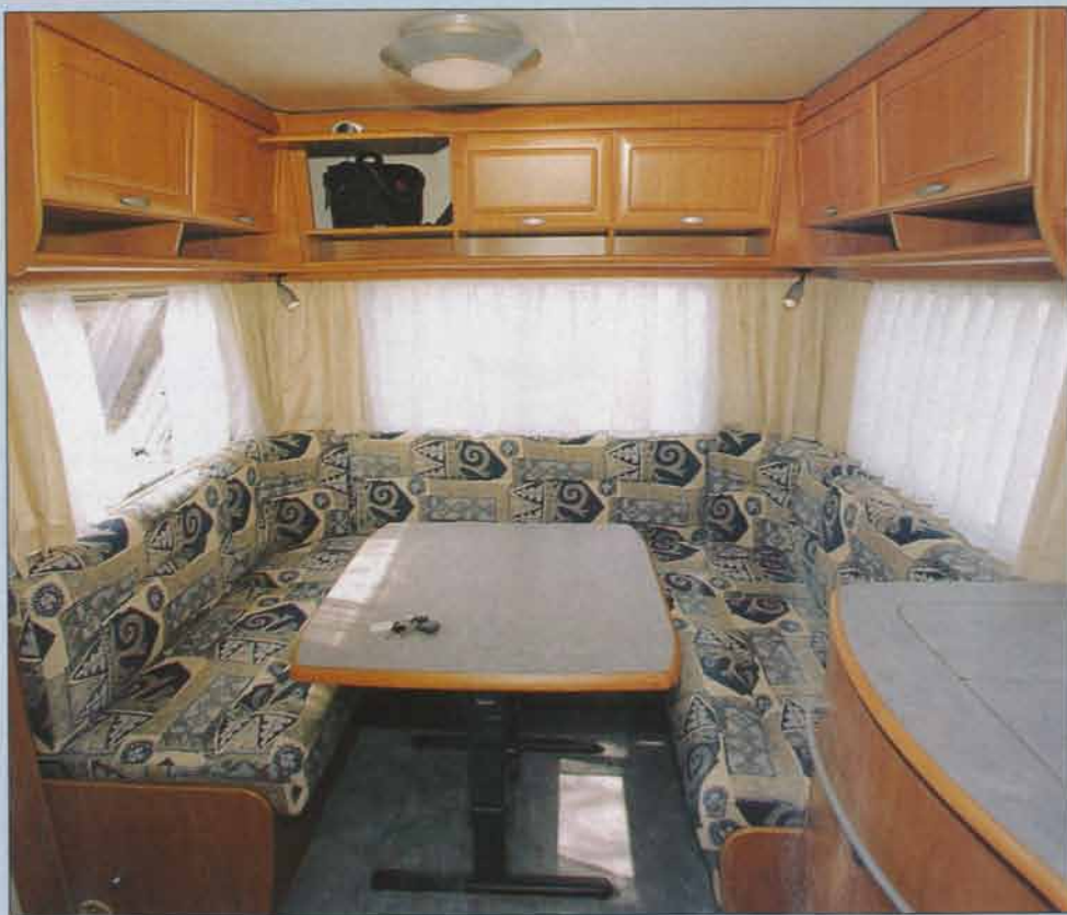
Sittgruppen omges av tre stora fönster.