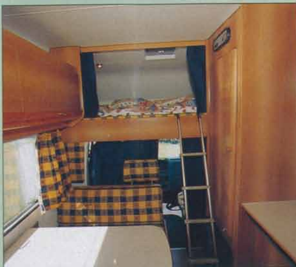
Toaletten är ljus och fräsch.

Marlin 58 är registrerad för fem personer. Den bakåtvända sittplatsen närmast mittgången får inte brukas under färd.