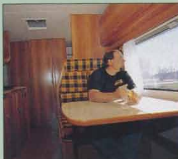
Fyra får plats vid bordet, men det blir trångt.