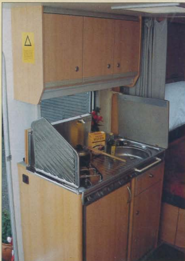
Med de fällbara luckorna kan man öka och minska arbetsytan efter behov.

mening är fullt tillräckligt i ett fritidsfordon – har man också fått en liten extra avställningsyta mellan spis och disk.