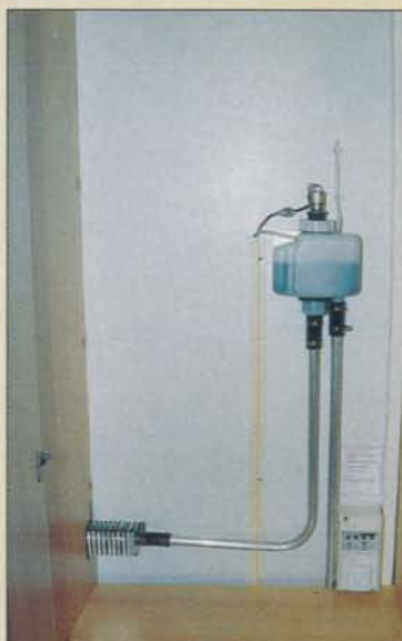
Expansionskärl bra placerat, så att det är lätt att fylla på vid behov.

Garderoben är perfekt, 70 centimeter bred och med klädstången så