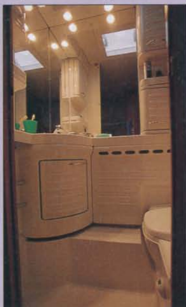
Toaletten är rymlig med många fack och utrymme för alla småsaker.

Med fast bord, som är standard, blir det gott om plats vid sittgruppen fram för hela familjen. Men det är tungt att bädda.