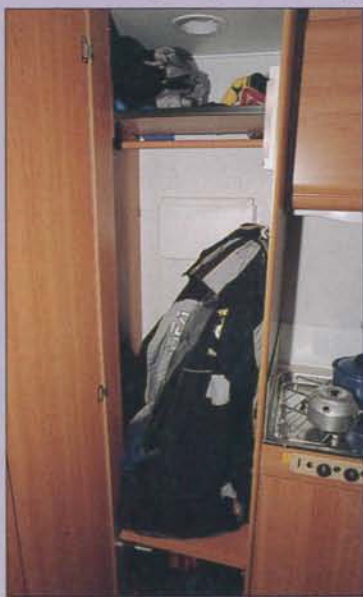
Vagnens enda garderob ger inte mycket utrymme om vinterjackorna hängs in.