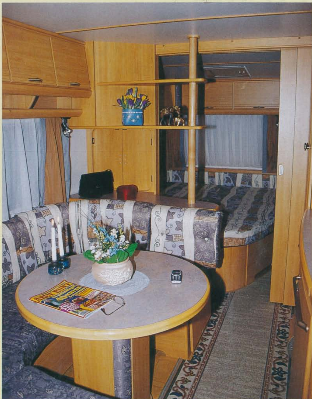
LMC 595 MDK är en trevlig familjevagn, bilden tagen direkt när man kommer in genom dörren och har barnkammaren till vänster.

na är bara nio respektive elva centimeter tjocka. Det finns ett stort öppningsbart fönster längs med varje säng och båda har nattlampa. Fallskydd mot såväl fönstret som in mot husvagnen hör till överbädden. En liten steg sitter vid fotändan mellan sängarna. Tips till tillverkaren: Gör gärna platta steg i stället för runda. Det kan vara skönare även för små fötter.