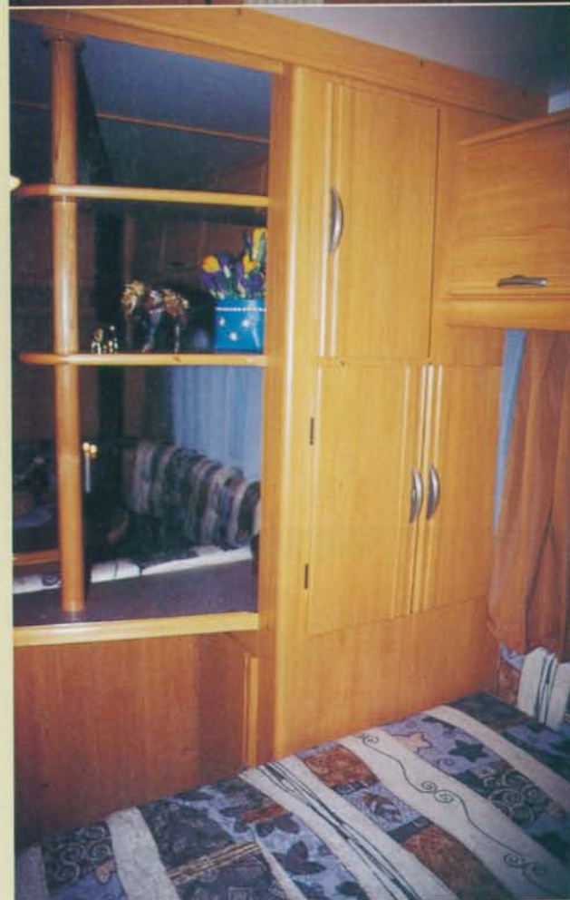
Dens snygga förvaringshyllan här sedd ifrån "sovrummet".

mindre kameror får plats. Bra! Fin belysning över spegeln sprider ett behagligt halogenljus.