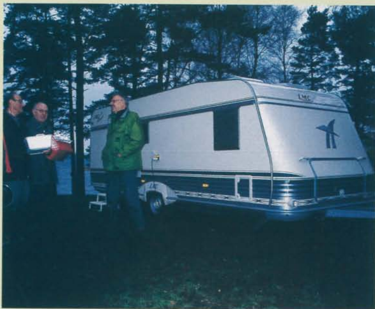
En ny husvagn på campingplatsen röner intresse bland säsongsgästerna.

på den ena sidan, men på den andra sidan sitter en extra bäddskiva att fälla upp. Detta innebär att här inte finns något stopp för de två yttersta sittplymåerna, vilka trillar ned i golvet så fort man reser sig eller går emot dem. Det borde vara en enkel sak att åtgärda.