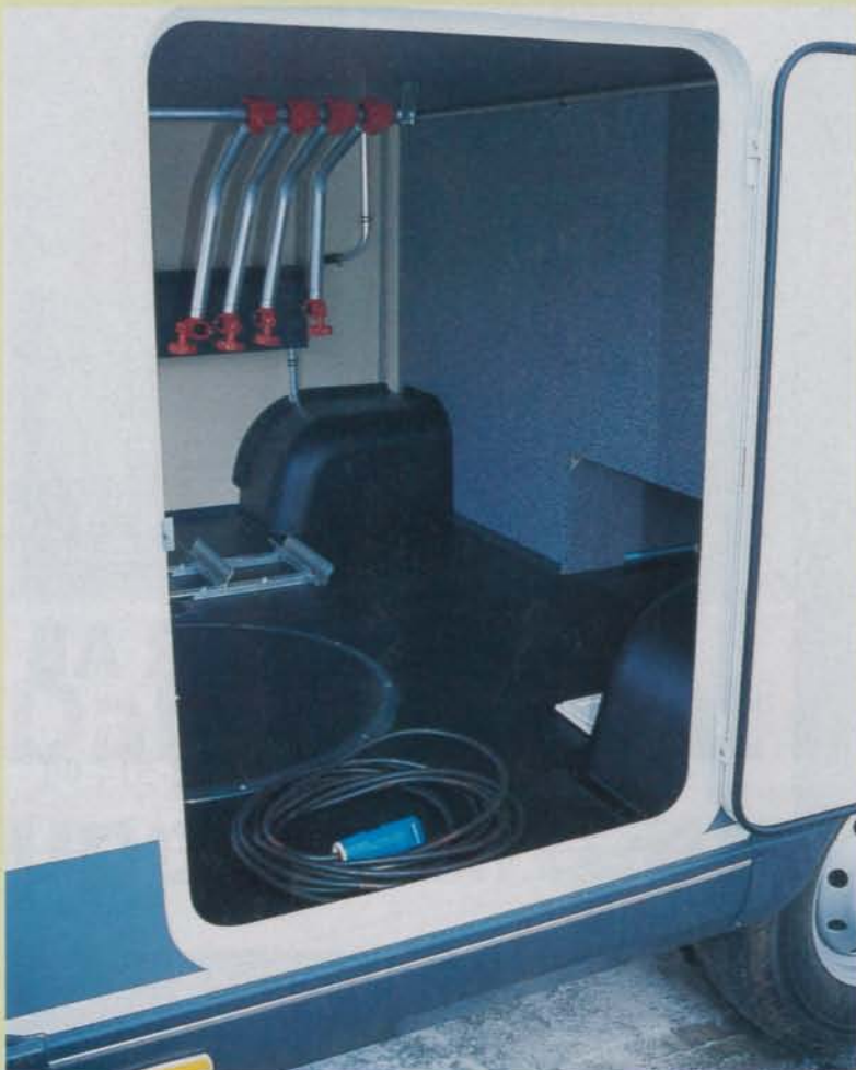
Även från bilens långsida kan man nå in till det stora utrymmet bak i bilen.

En annan utvändigt lucka leder till ett utrymme där avtappningskranarna finns för vatten och avloppstankarna. Där sitter de lättåtkomligt, rent och uppvärmt. Mycket bra.