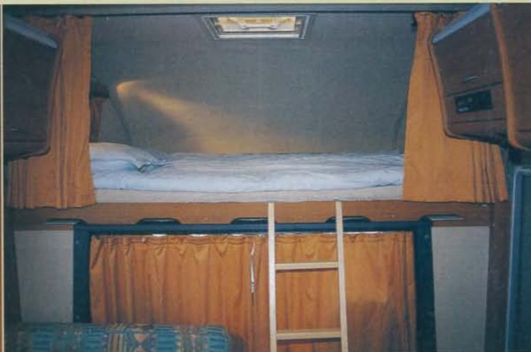
Alkoven ger sovplats med bra utrymme för två vuxna personer.

Körmassigt är bilen smidig och stabil trots sin storlek. Ett fordon som inbjuder till resor, och som har gott om stuvutrymmen för packning i både mängd och volym. Dessutom har bilen så god lastkapacitet att den tillåter omfattande och tung last.