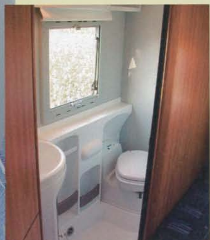
Hygienen sköts utan problem i det ljusa och rymliga toarummet.

anpassas till stundens behov. Ett minus får dock bordet för skruven man använder för att höja och sänka bordet. Själva handtaget består av en ”mutter” i plast, aningen skårad för greppets skull. Men skåraderna är för grunda för att ge ett bra grepp. Och dessutom är handtaget för litet för att man ska kunna greppa med hela handen och för stort för att man ska få grepp med tummen och pekfingeret format som ett O. Så när jag ska prova att fälla bordet krävs ett uppåtbående av all