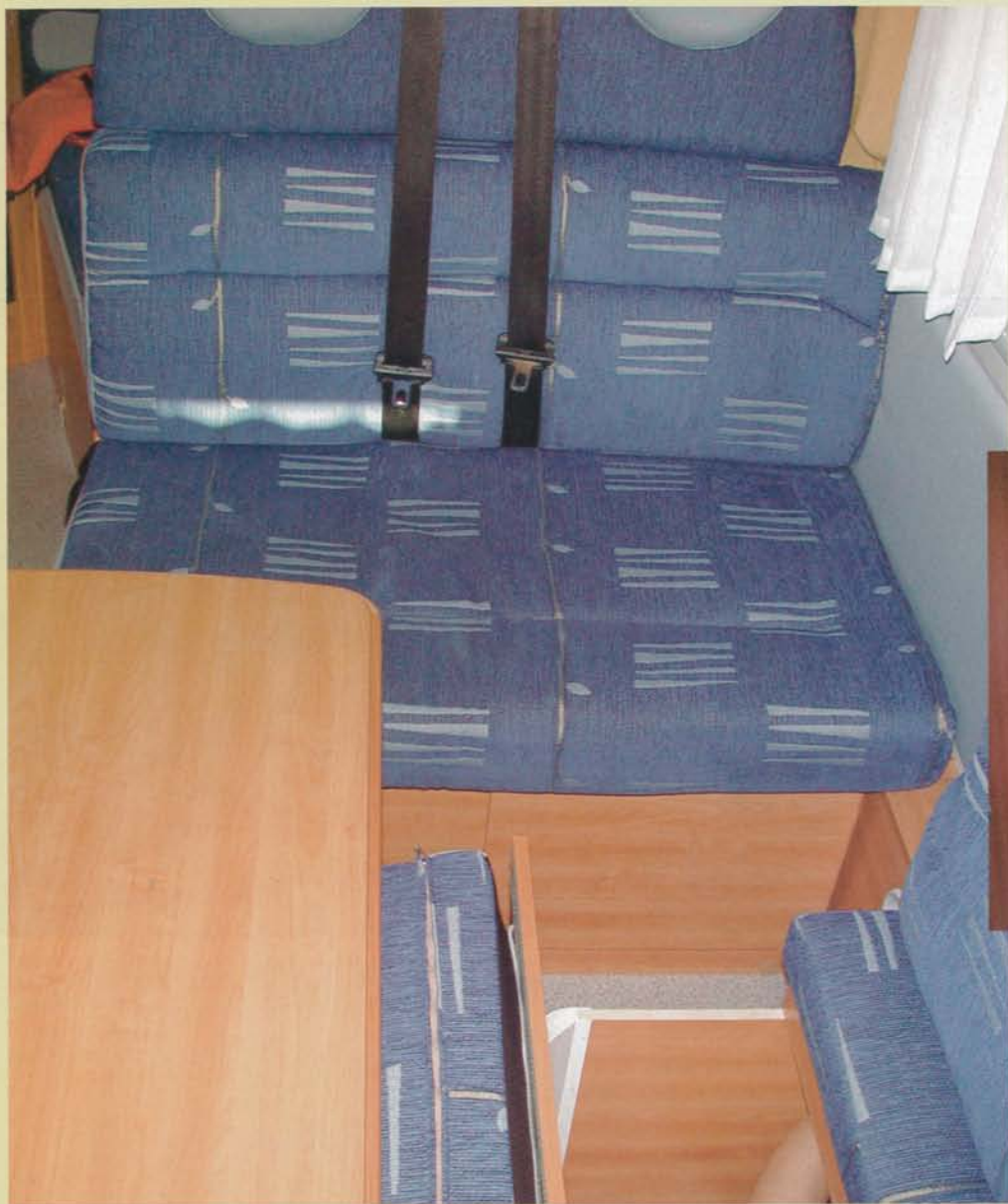
En bit av dynan plockas bort och träskivan fälls ned och vips har vi plats för benen i den framåtvända delen av soffan. Tvärsoffans lock fälls utåt när man behöver nå eventuell packning där.

toaväggen hindrar användaren från att plocka med sakerna från sidan. Den inre delen av lådan når vi inte alls från insidan om vi inte kryper ned i lådan. Fast det är ju inte något stort problem att vi får gå runt husbilen på utsidan och använda lastluckan istället.