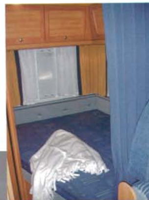
Dubbelbädden kan avskärmas med hjälp av ett stadigt draperi, sytt i kanaler med plastskenor som ger stadgan.