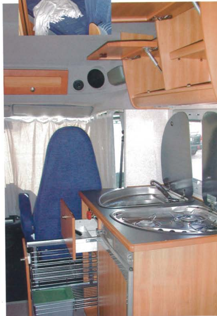
Snyggt och prydligt pentry, men snålt om plats för husgeråd och matlagning.