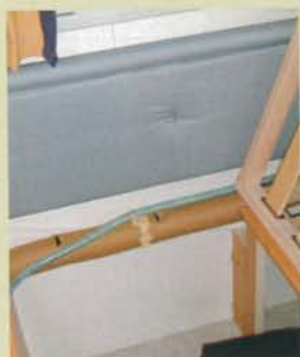
I sänglådan finns ett varmluftsutblås och slangar med skurna luftsliksar ger värme mot ytterväggarna.