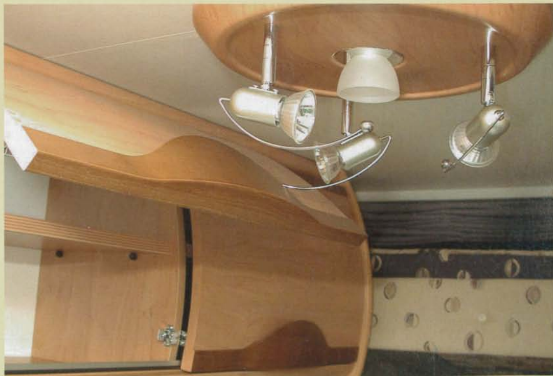
När mittenskåpets lucka öppnas i överskåpsraden ovanför sittgruppen slår den i lampan. Det är inte bra, vare sig för lampan eller skåpluckan.