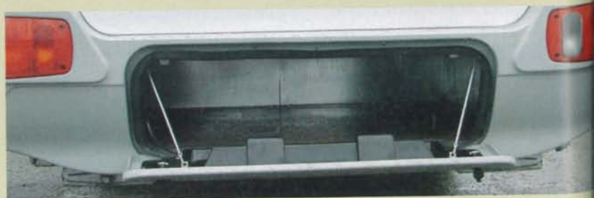
I den bakra stötfångaren finns en liten lastlucka infälld. Där kan exempelvis trädgårdsmöblerna lätt stuvras undan.