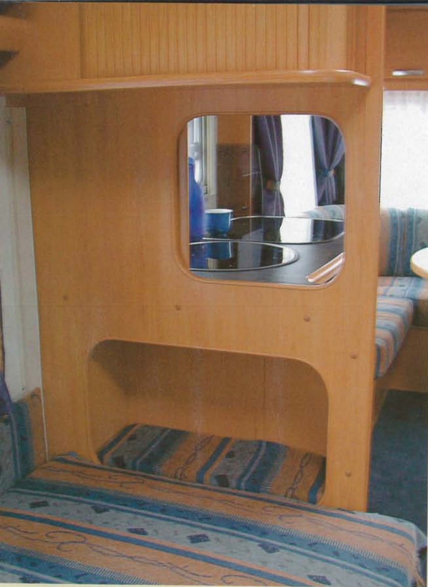
En nisch för fötterna förlänger den ena bädden och hålet i väggen ger ljuset fritt spelrum. Öppningen kan dessutom stängas med en liten skjutsdörr vilket är praktiskt när någon vill vara ifred.

sovavdelningen och pentryt. Det är ju i och för sig lovvärt att ordna så att det går att se på tv ifrån bägge hållen i vagnen, men just i den här vagnen hade detta skåp verkligen behövts till kökets alla attiraljer. För i nuvarande skick är det väl litet för ett tvåpersonershushåll. Ett minus blir det också för att det saknas avsedd plats för soppåsen. Varför finns det så många campingfordonskonstruktörer som tror att man kan hoppa över den detaljen?