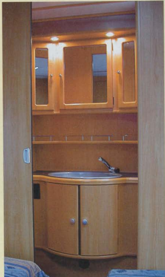
Den snygga hygiendelen drar blickarna till sig längst bak i husvagnen.