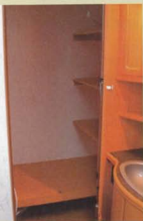
Garderoben har bra bredd och de tre rejäla hyllorna ger gott om plats för liggande kläder. Vi saknar dock ett värmeutsläpp i garderoben.

Svårt att hålla rent blir det också vid sänglådans fotända i den högra bädden. Där finns ett några millimeter brett mellanrum mot skjutdörren för skräp och damm att ramla ned i – och de millimetrarna räcker inte till om man vill nå ned med en sop eller trasa. Den missen känns extra fånig när vi konstaterar att sänglådorna vid huvudändan på samma säng är indragen ungefär 10 centimeter, så där är det inga som helst problem att komma åt att hålla rent. Den vänstra sängens låda sitter monterad emot respektive vägg mot badrum och pentry, för