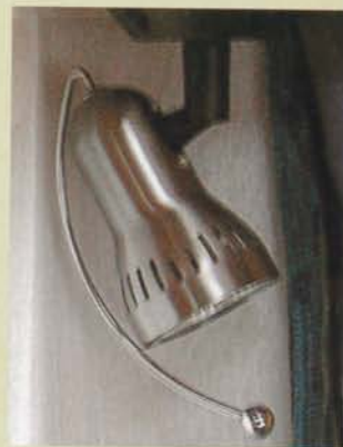
Sänglampornas design är både snygg och praktisk. Här slipper vi ju ta i den varma lampan när den ska riktas.

Utomhusbelysningen på LMC består av tre spotlights inbyggda i en liten ram ovanför bodelsdörren. Den tänds och släcks med hjälp av en fjärrkontroll. Och sådana finesser är ju alltid barnsligt roliga. ●