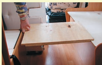
Det går inte att bädda ned sittgruppen till säng när träskivan som ska fylla upp utrymmet mellan sofforna är för kort.

Umgängsdelen består alltså av en framåtvänd soffa, en tvärsoffa samt förarhyttens två vridbara stolar. Vi får en del problem innan vi listat ut hur förarstolen ska vändas och när det kommer till hur man gör för att förlänga bordet så att det går att äta vid det även i tvärsoffan misslyckas vi helt. Vår fantasi räcker helt enkelt inte till. Så husbilens handbok får plockas fram. Vilket inte gör oss ett dugg klokare – eftersom vare sig stolarna eller bordet finns med i den. Urdåligt! Dåligt är också det faktum att den lösa träbit som ska fylla i öppningen mellan sofforna när sittgruppen bäddas ned är för kort och helt