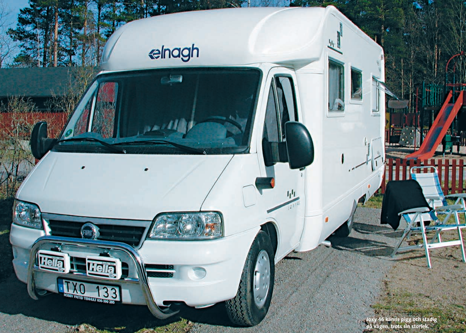
Joxy 46 känns pigg och stadig på vägen, trots sin storlek.