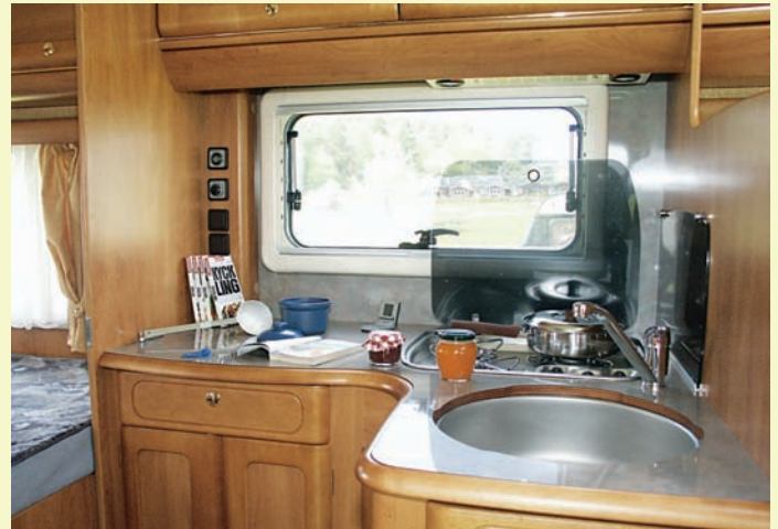
Den vinklade köksbänken är inte stor, men ger ändå en arbetsplats med bra avställningsyta.