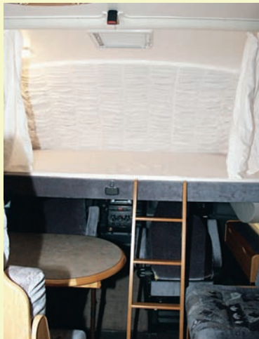
Extra sovplats finns i den fällbara alkovbädden, som är lätt att klättra upp till. Bra utrymme och bra komfort ger den.