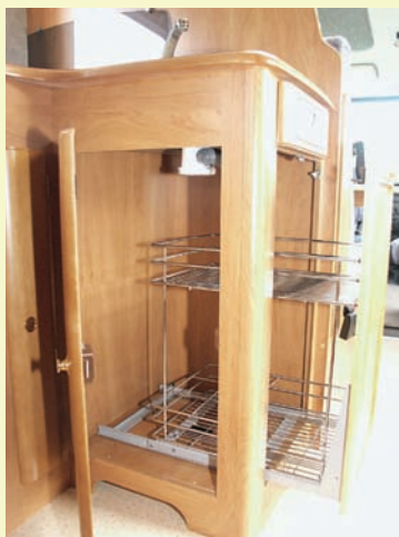
Praktiska, utdragbara trådhyllor finns i köksbänkens underskåp. Lådfronten i överkanten är just lådfrent. Någon låda finns inte.

Två ovenskåp på ena väggen och ett på den andra utgör förvaringsutrymmena vid sittgruppen. Dessutom finns små fack bakom luckor under ovenskåpen, med plats för lite av varje i småsakssegmentet. Utrymmet i tvärsoffan tas helt upp av vattentanken, medan lådan i den långsgående soffan är fullt disponibel för packning. Batteriet finns visserligen här, men det är