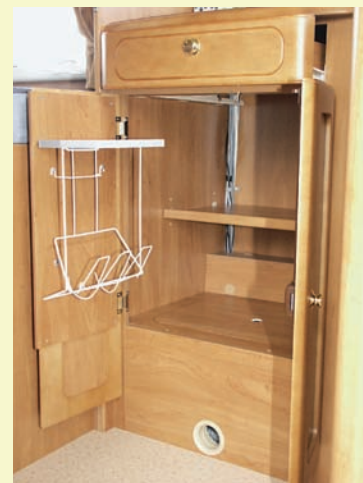
Det rejäla skåpet under arbetsbänken rymmer mycket, bland annat plats för soppsåsen.

Köket är i vinkel, och trelågig spis, diskho och en rejäl avställningsplats ingår i köksbänken. Två förvaringsskåp plus två mindre hyllor finns ovanför arbetsbänken. Nederdelen av bänken är inredd dels med en besticklåda, dels ett underskåp med dubbelörrar och plats för bland annat soppsåsen. I köksbänkens gavel finns – uppifrån sett – en lådfrent, men ingen låda! Därunder ett utdragbart skåp med tråd-