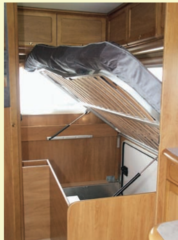
Under dubbelbädden finns ett stort utrymme, som också kan nås via lucka utifrån.

bänken, och det uppskattas. Även centrallåsningen av öppningsbara fönster är en positiv erfarenhet. Det underlättar.