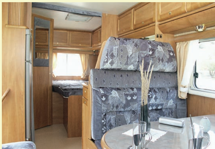
Sittgruppen finns direkt bakom hytten, och sammantaget går det att få plats även för besökare till bords, om man vill det.