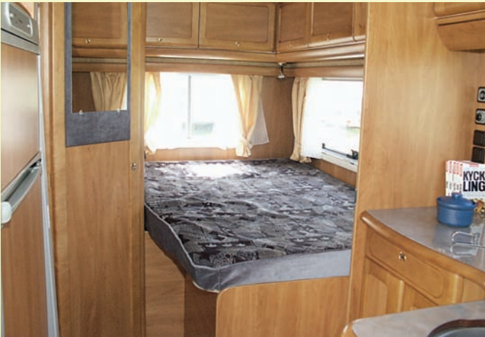
Dubbelbäddens tjocka underlag är liggvänligt, bäddbredden okej men längden är i underkant.