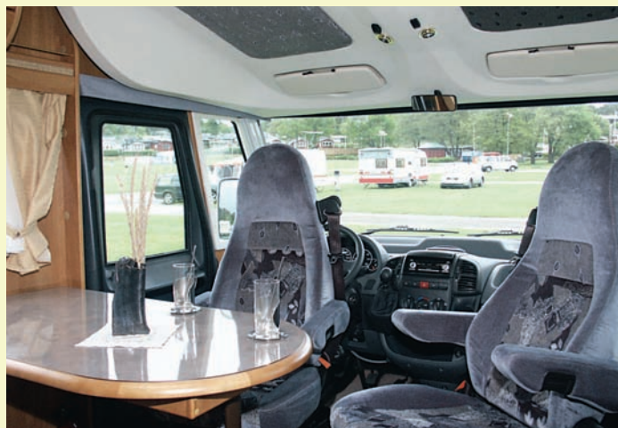
Hyttstolarna kan vändas in mot bodelen, och då får man hyttens generösa utsikt till skänks.

Vi tar plats i tvärsoffan, och känner att det är en sittgrupp man kan trivas i. Eftersom det är en helintegrerad bilmodell, får vi hyttens hela panoramautsikt till skänks.