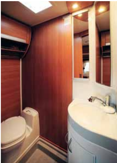
Omdömet om Cabbys tvätttrum: Ett ombonat rum med hygglig funktion.