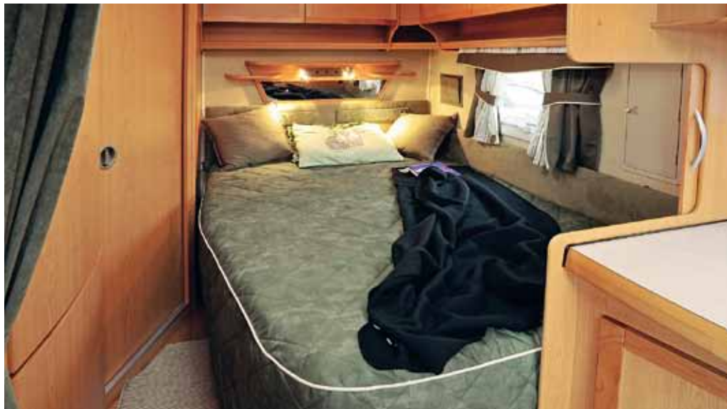
Sovrummet i Kabe är ombonat men sängen är för kort, 190 cm. Normmättet är 195 cm.