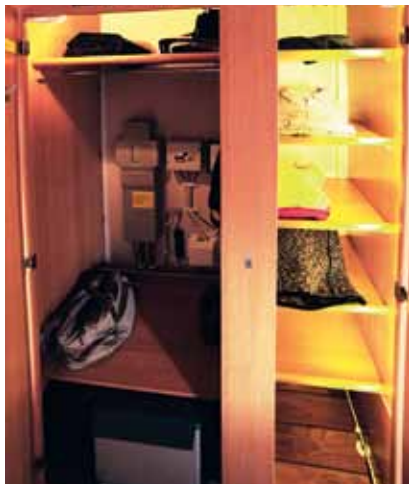
Bra ordnat för en längre tids boende i Cabby. Hänghöjden räcker inte riktigt.