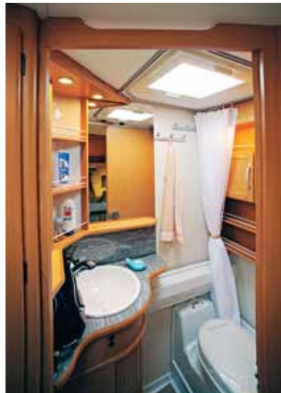
Duschdraperiet i Kabe ersätter inte en riktig kabin men skyddar från stänk.