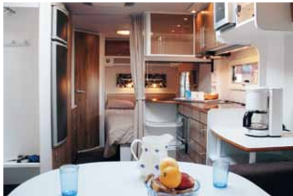
Modern och trendkänslig. Både färg och form är avvikande från traditionen. Återstår att se om det blir trendsättande.

Cabby.....8 poäng Kabe.....8 poäng Polar.....8 poäng