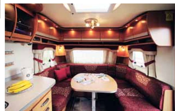
Cabby har en sittgrupp som också lockar till sig folk. Plats för både umgänge och soffliggare.

Polarna ryms i Polarvagnen. Sittgruppen som rymmer sex personer till middag som samtliga sitter bekvämt är berömlig. Att man sitter i modernt designade soffor gör det inte mindre komfortabelt. Bordet är klassiskt utformat med rundade hörn