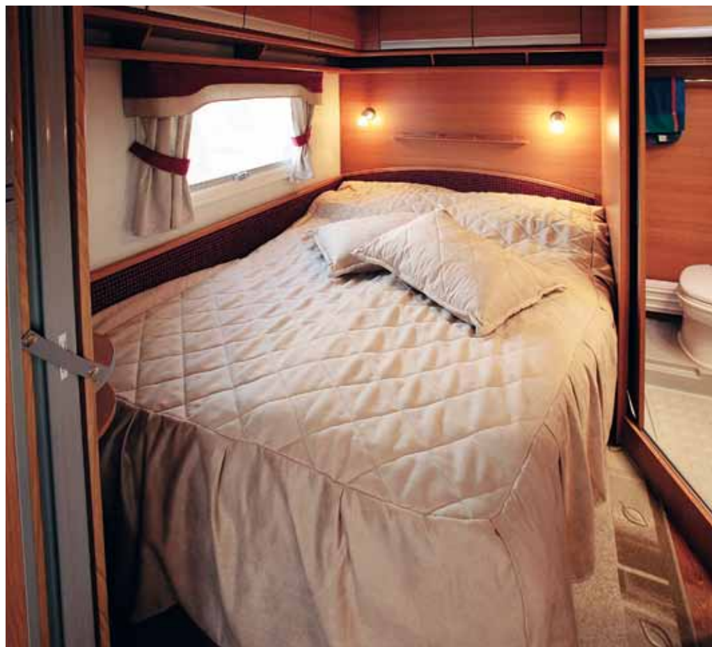
Cabbysängen håller måtten både vad gäller längd och bredd. Lastutrymmet under sängen är lättillgängligt både utifrån och inifrån.

En del klagomål har vi på bädden i Kaben, framför allt från längste man i testteamet. Bädden är 190 centimeter, fem centimeter kortare än normmålet, och den som har samma kroppslängd som bädden får inte full bekvämlighet. Bredden är fullt godkänd. Underlaget får beröm, bäddmadrasser finns och bädden är skön att sjunka ner i. Huvudgärden kan lyftas upp så att man får den lutning man önskar. Läslampor och avställningshyllor finns, plus en liten diskret nattlampa som man tändar med knappen precis vid huvudet. Känns →