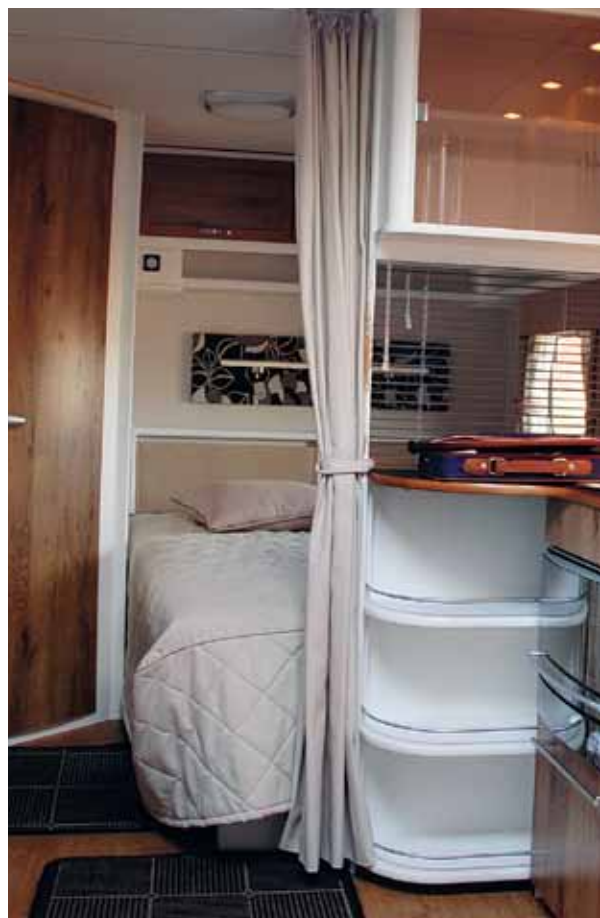
Jalusi och draperi skiljer sovrum från kök i Polarvagnen.

Äntligen en säng för personer över medellängd! Fin madrasskomfort inklusive bäddmadrasser. Bra belysning och hylla för småsaker. Rymliga genomluftade skåp och en byrå för småkläder.