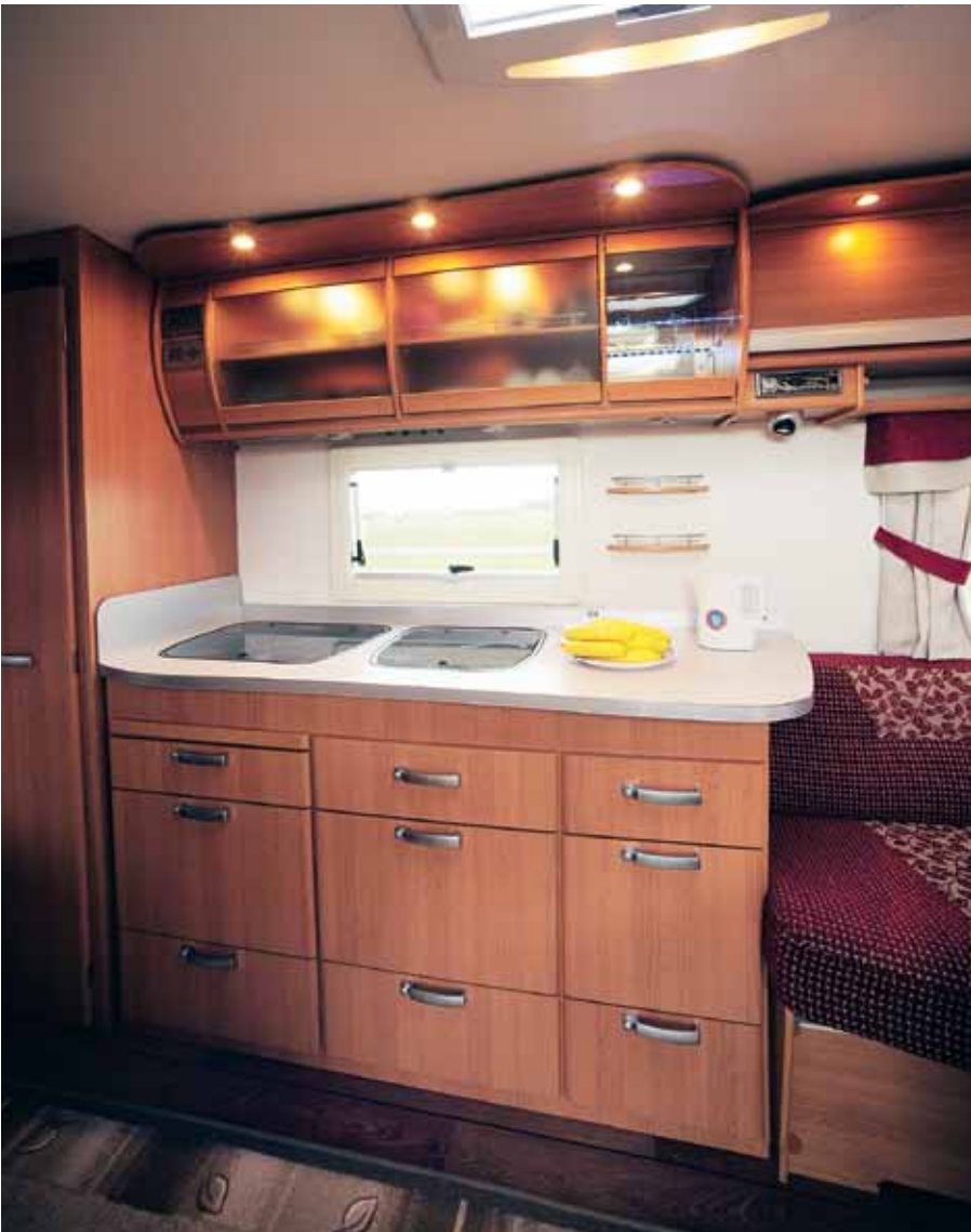
Lite eftergift år modernt bling har man även i Cabbyköket. Lagg märke till den lysande glaskanten i vitrinskåpet. Spis med ugn finns som tillval.