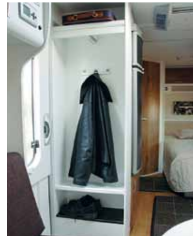
Garderoben vid Polars entredörr kompletterar byrå och huvudgarderob.