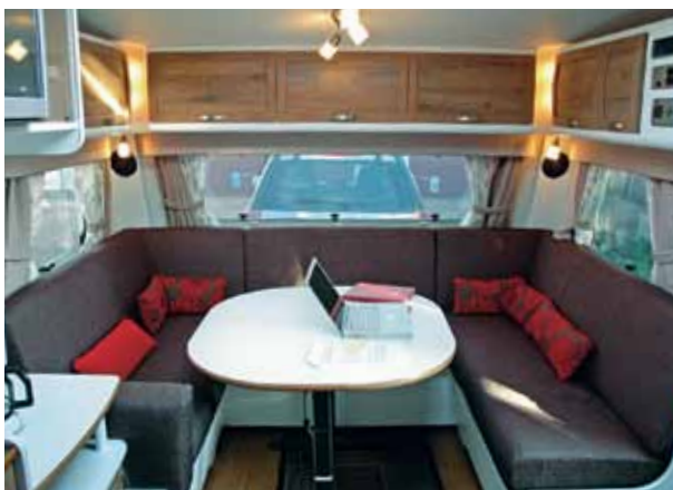
Sittgruppen i Polarvagnen håller idealmått på alla platser. Lägga märke till att dynorna inte är formskurna. Sköna ändå.