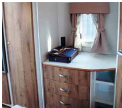
Byrå i sovrummet hör inte till vanligheterna. Finns i Polar 5600.

Det blir poängavdrag för att sänglängden inte når normmättet, och därmed blir obekvämt för personer som är över medellängd. I övrigt är bädden bekväm, och ifråga om belysning, avställningsplatser och annat som gör sovplatsen skön finns inga invändningar.