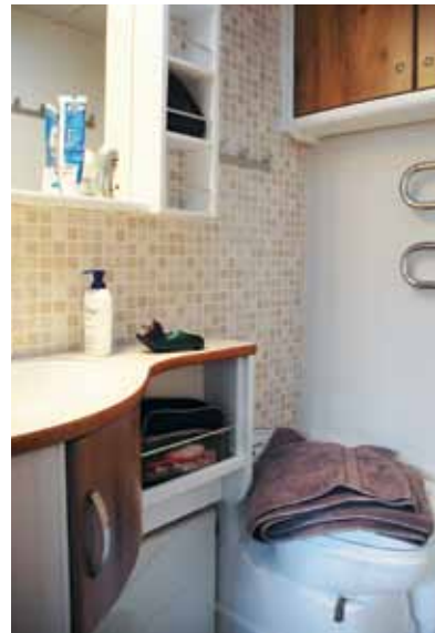
Handdukstork, mosaiktaket och vita snickerier. Trendig även på muggen.

Hygienutrymmet i Cabbyn är inte överdådigt, men där finns vad man behöver. Bredden framför tvättstället är tillräcklig för att man ska klara tvättproceduren friktionsfritt, och höjden är bekväm vid tvättstället. Benutrymmet framför toastolen är godkänt med mycket god marginal. För förvaring finns ett väggskåp och ett skåp under tvättstället. En skojig detalj är att hörnspegeln är vändbar. Det är alltså spegel på ena sidan, sväng runt den och du hittar hyllor för hygienartiklarna på den andra. Duschmöjligheten är begränsad, utdragbar handdusch är vad som bjuds.