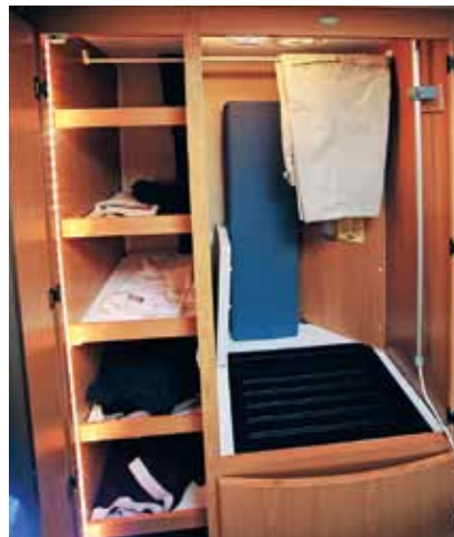
Kabe. Plastbrickan i botten är löstagbar och släpper upp värme från pannan.