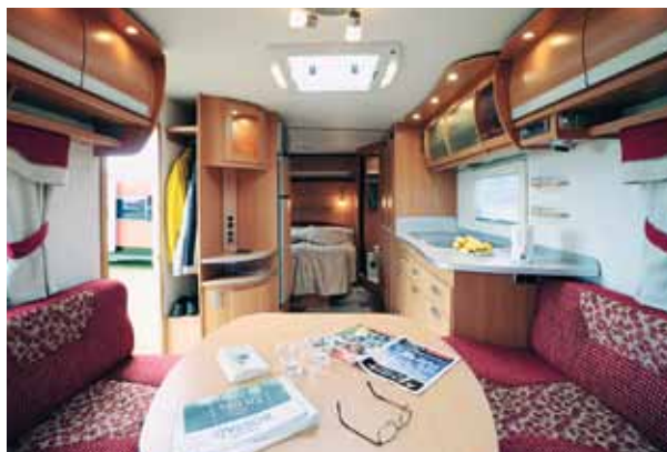
Cabby har en fint fungerande och inbjudande interiör.

Torbjörn: Jag väljer utan att darra på manschetten Polar 5600. Den har härligt god funktion och dess färg och form pekar med hela armen mot framtiden. Den känns också lockande för nya målgrupper.