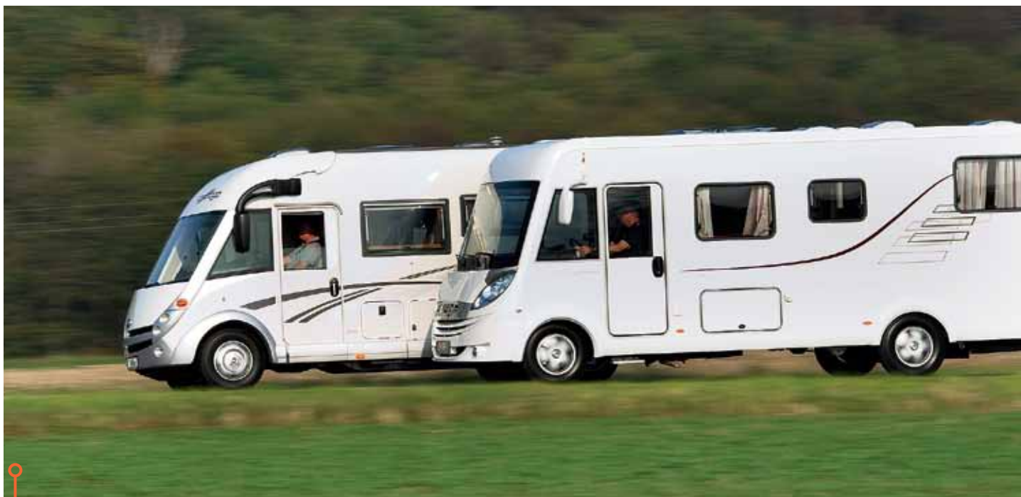
Med nya B-Klass kör Hymer förbi Carthago som bjuder upp till en jämn kamp. Bilarnas för- och nackdelar ligger i olika ronder.