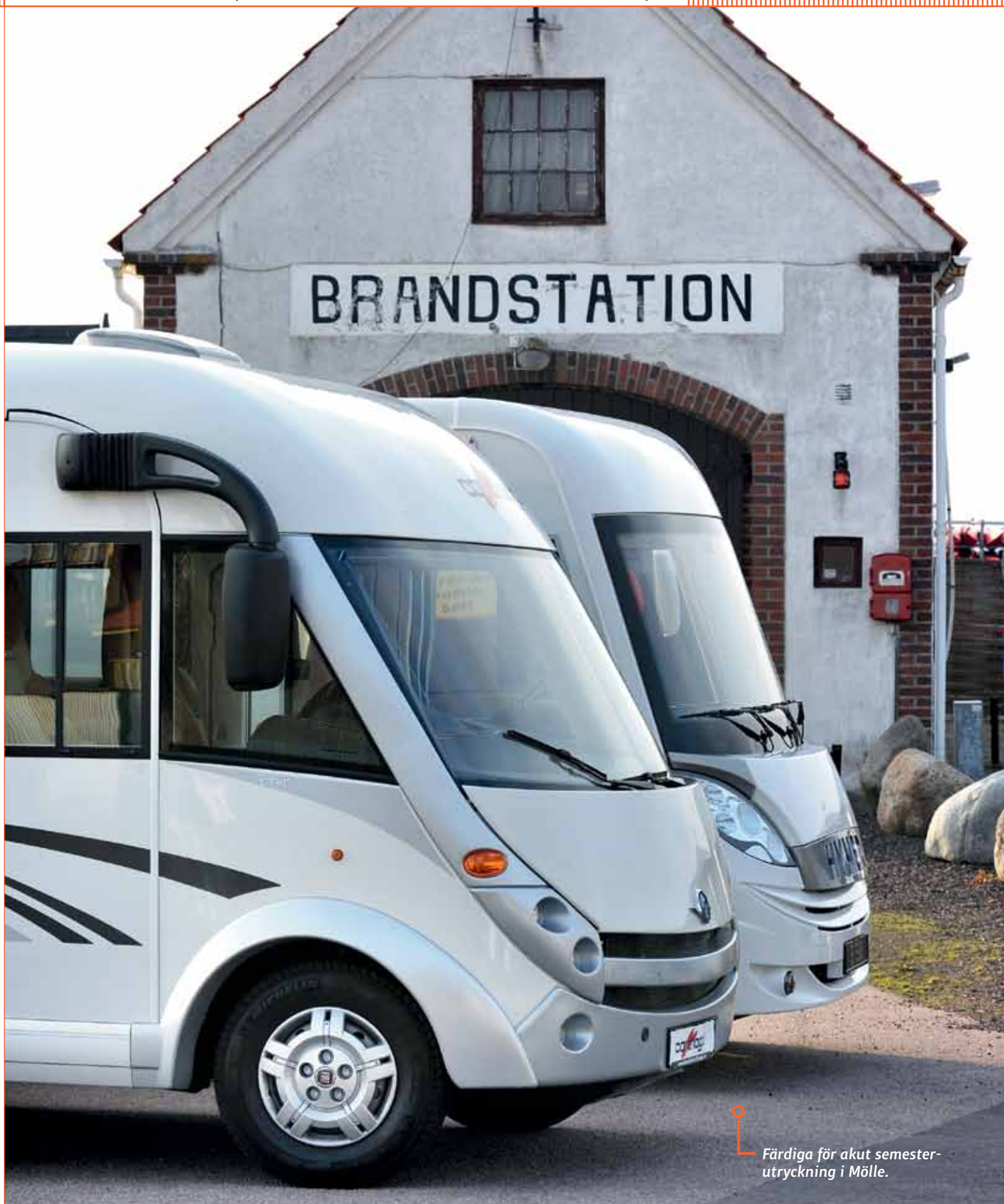
Färdiga för akut semesterutryckning i Mölle.