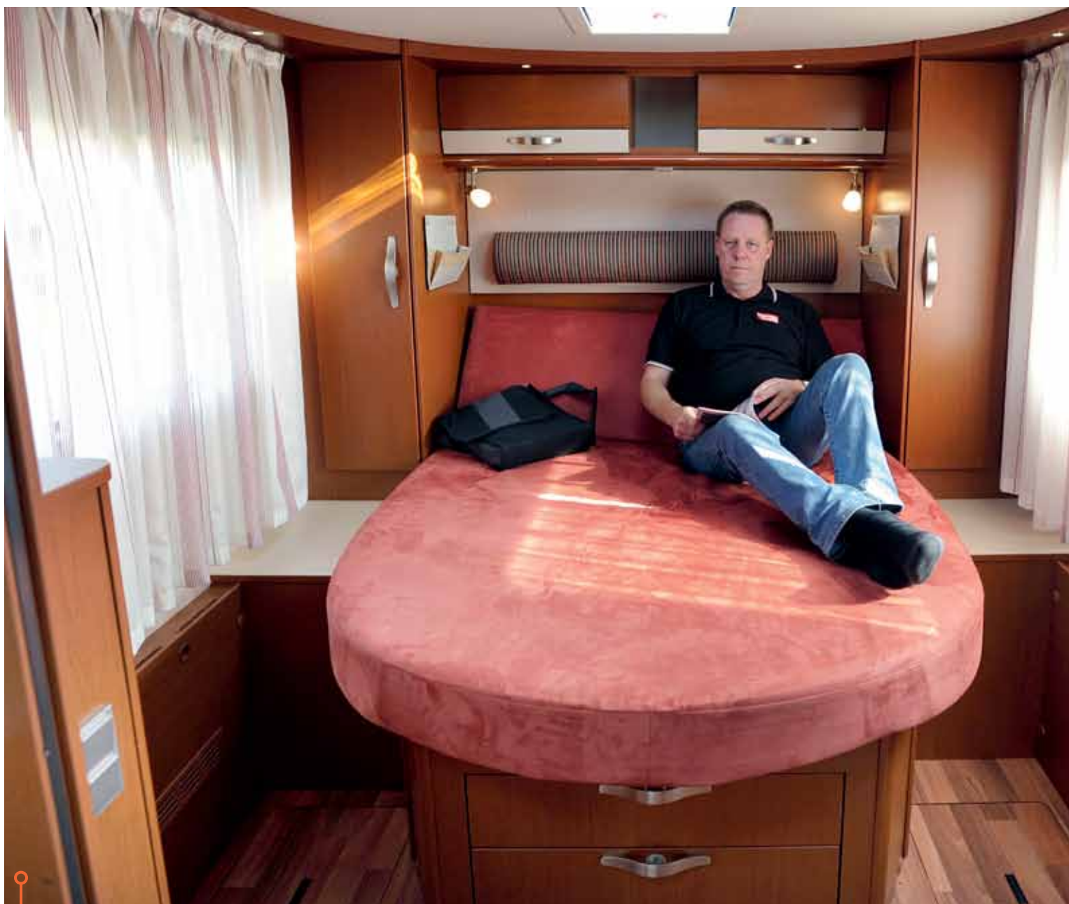
En säng som är en soffa som är en divan som ger stora ytor på sovrumsgolvet. Därför är det en drömlösning. Hymer.