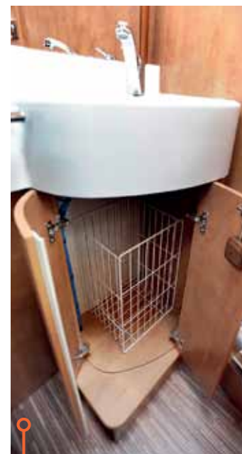
En trådkorg under handfatet i Carthago.

»Det är vid den bakre dubbel-sängen som Hymer seglar iväg med en extrapoäng.«