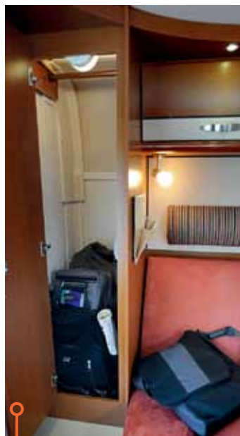
Garderoben i Hymer får med beröm godkänt.