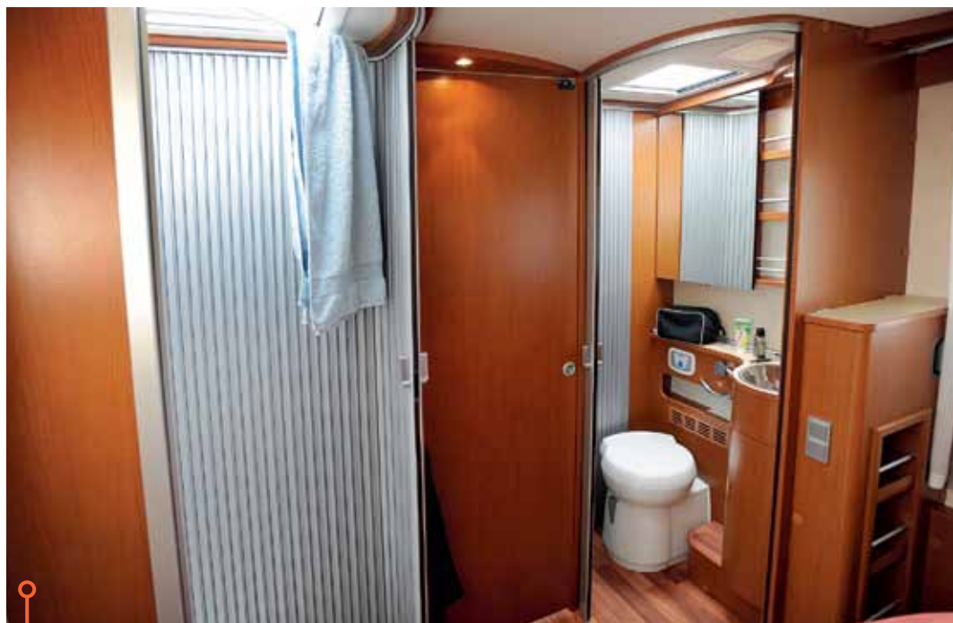
Smart jalousidörr i Hymer ger mycket betydelsefulla tio centimeters extra utrymme.