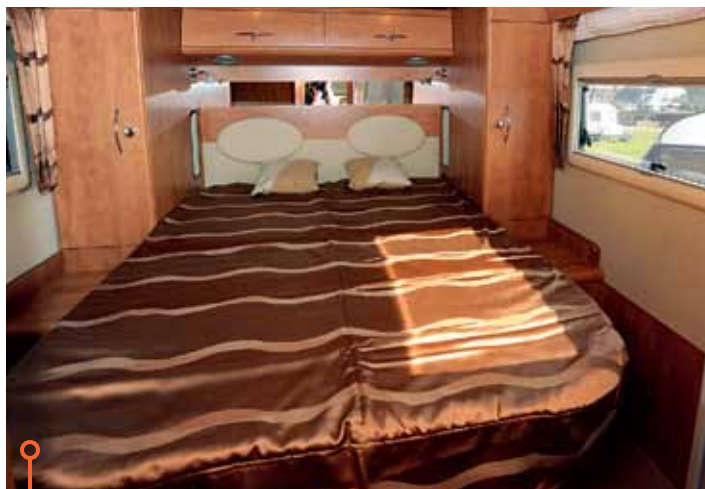
Sovrummet i Carthago skapar en atmosfär som på lyxhotell.