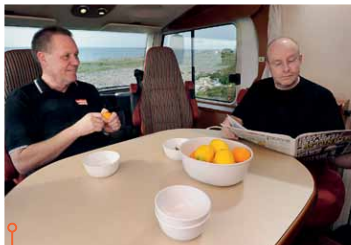
Förar- och passagerarstol är bästa platsen men där har man ju redan suttit en hel dag...

» Ingen av bilarnas bästa rond – det är varken bra eller dåligt utan bara sådär.