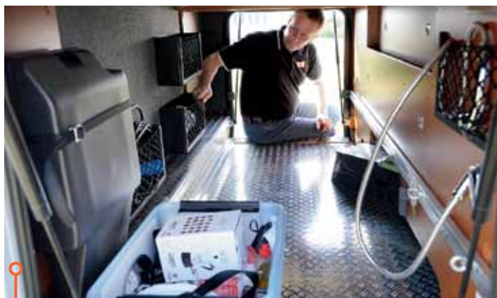
I Hymers lastutrymme råder ordning och reda.

I DET BAKRE LASTUTRYMMET får man hos Carthago plats med allt och lite till. Här kan man stuva in cyklar, utemöbler och skidutrustning, och ändå få plats över för diverse persedlar som man för stunden inte behöver ha inne i bodelen.