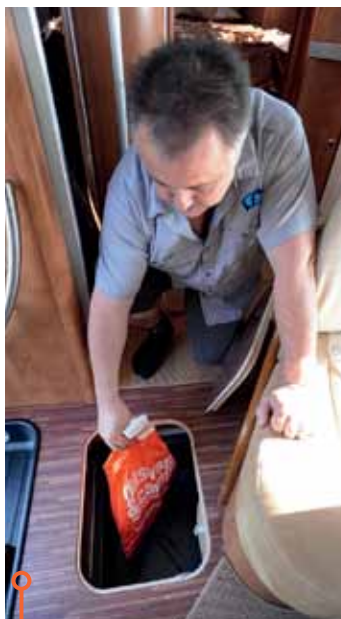
Djupa stuvfack i Carthago sväljer till exempel ett par storstövlar.