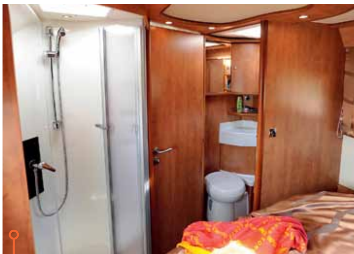
Vikdörren i Carthago är en sämre lösning. I övrigt lika fint.