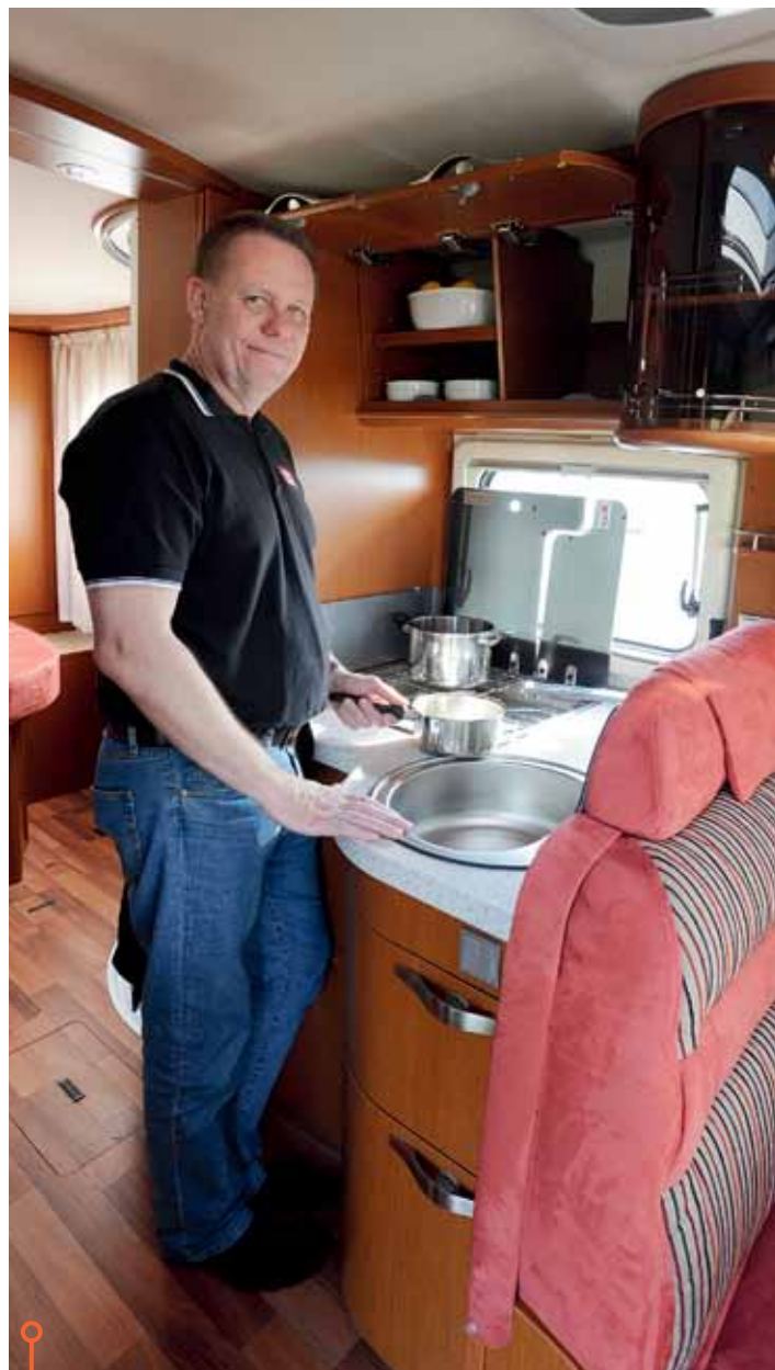
Ett bättre kök i Hymer, men långt ifrån förstklassigt.