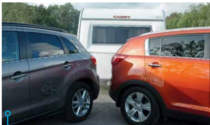
Modern design med sluttande taklinjer lämnar små ytor för fönster. Korta överhäng bidrar till stabilitet.