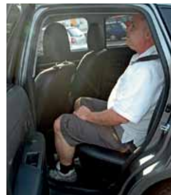
Baksäteskomforten är en aning bättre i KIA med bättre både knä- och huvudutrymme.