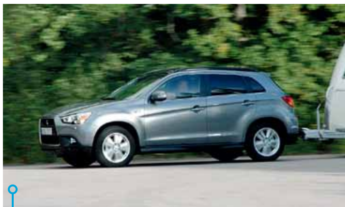
Full fart framför fotografen för fina foton. ASX är en trygg dragare, bra vändradie och av dessa två – bäst bakåtsikt.