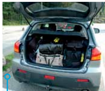
Betydligt mindre bagagerum och lägre släpvtikt.

»All den förfinade tekniken ombord gör det lättare för ägaren att köra bil med hyggligt bibehållet miljösamvete.«