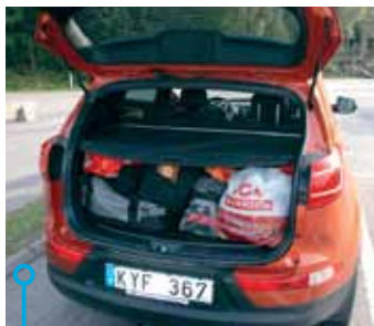
Fullt trots stort utrymme. Reservhjul under golvet.

med även lastförmågan är inte klar än, totalvikten är 2 140 kilo. Max släpvtikt med B-kort blir då 1 360 kilo. Bilen i sig klarar 2 000 kilo släp, med automatlåda 1 600 kilo. ASX är godkänd för 460 kilo last och 1 400 kilo släp. Här höjer inte BE-körkort släpkapaciteten.