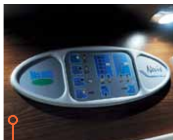
Manöverpanelen i McLouis är pedagogiskt utformad.

Nu är inte detta ett vintertest, men när temperaturen börjar