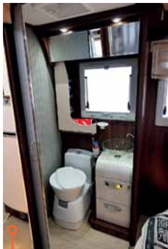
Det separata toarummet i McLouis.

Vid handfatet och toaletten, ja där är det faktiskt bättre med plats hos Eriba som dessutom har applicerat krokarna på väggen. När det gäller plats för diverse dusch- och tvättattiraljer och lösningar med takfönster och ventilation är de likvärdiga.