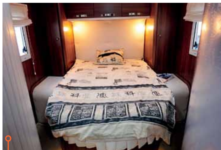
I den något längre McLouis finns det en så kallad queensbed.

» McLouis vinner ronden. Där slipper man klättra och de har löst avskildheten med större omsorg.