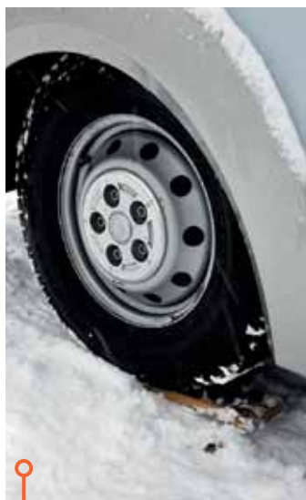
Bägge bilarna lutar framåt och kräver pallning under framhjulen.

» Parkeringssensorer, kurvlykt och backkamera känns mer nödvändigt här än på personbilar, där de är allt vanligare.