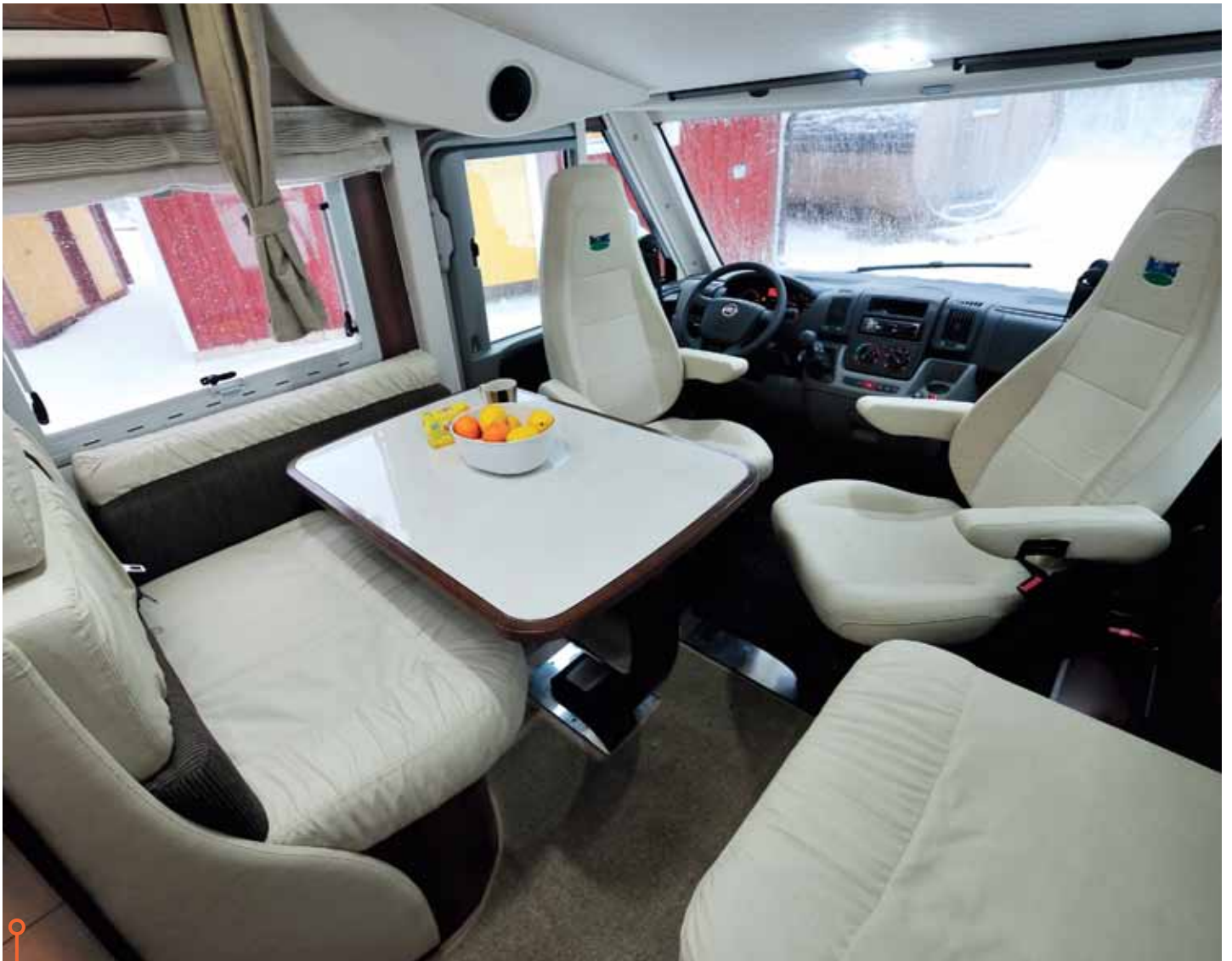
Inbjudande sittgrupp i McLouis, men komforten i sofforna är onödigt dålig på grund av för raka ryggdynor.