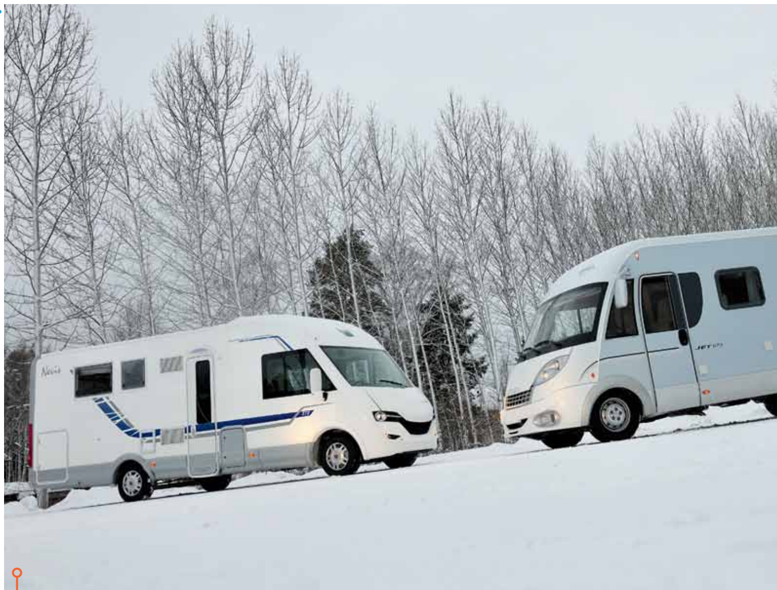
Vändradie, närsikt och behov av nivåklossar fram är lika i bägge bilarna.