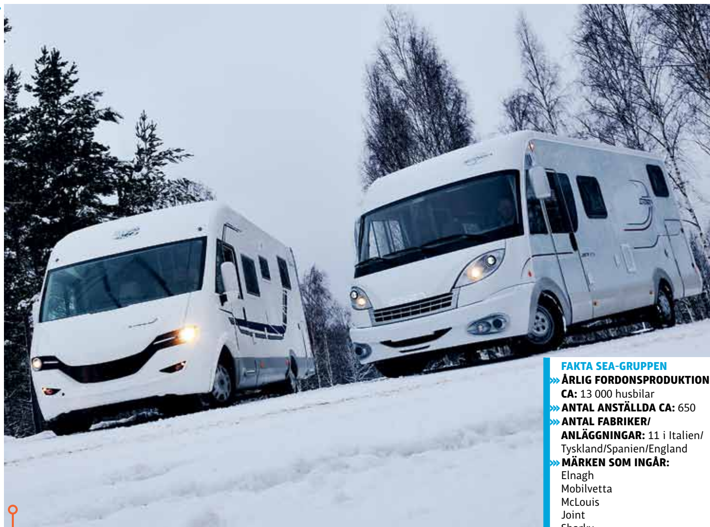
Två lättanvända och bruksvärdiga husbilar. Den dyrare Eriban är den mest kompletta, men den "billiga" bilen bjuder på överraskande goda egenskaper.