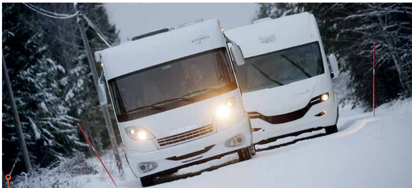
Tyst i klassen! Eriba Jet är imponerande tyst. Ljudet i McLouis är påtagligt.