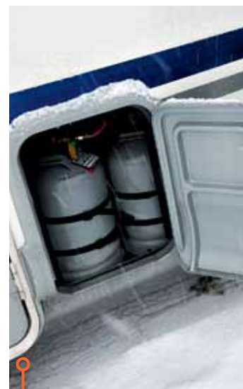
McLouis har det bästa gasolskåpet.