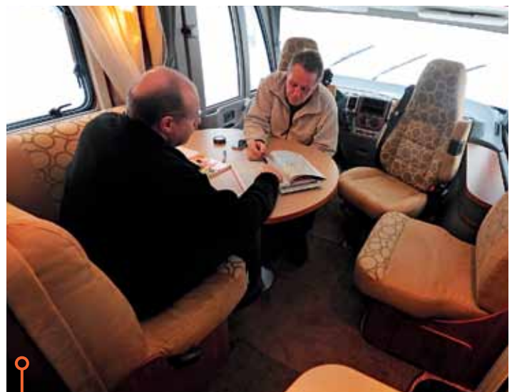
Ungefär lika osköna soffryggar i Eriba, vars sittgrupp har ett rundat bord.

» Oavgjort i en svag rond för dem båda. Här har tillverkarna något att jobba på framöver.