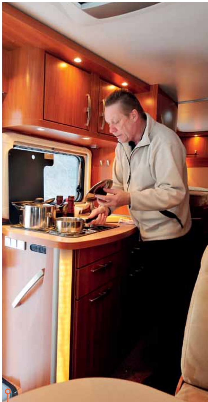
Eribas kök har mindre köksbänk men mer plats i bänken.