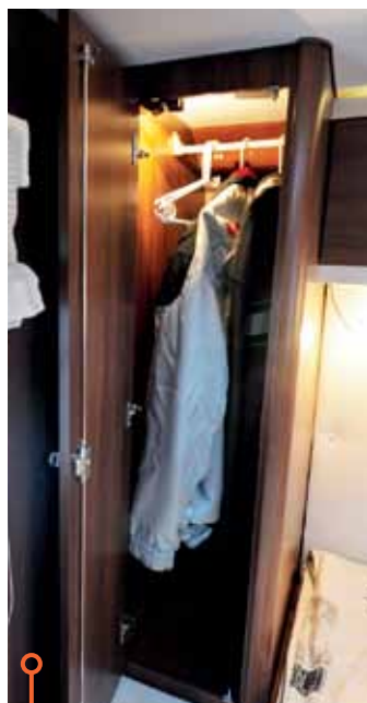
Bästa garderoben i McLouis med bra hänghöjd och bra belysning.

» McLouis har bättre garderober men i övrigt går allt Eribas väg.