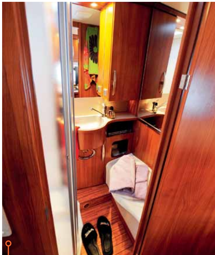
Eriba har ett ombonat tvättrum med duschkabinen till vänster i bild.

» Båda har här en mycket bra rond med ett visst övertag för McLouis, som har separat dusch och toalett.