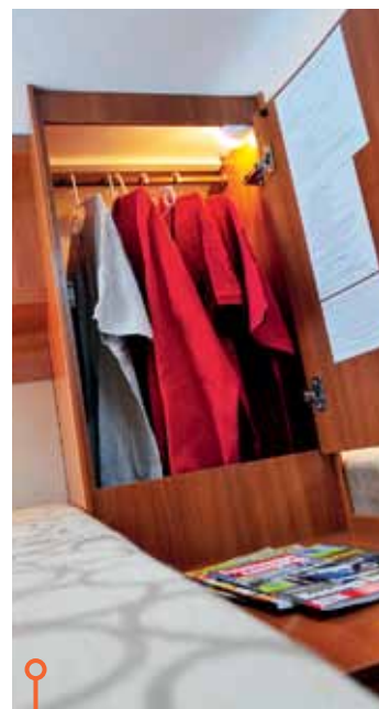
Eriba har sämre garderob men mycket bättre förvaring i övrigt.