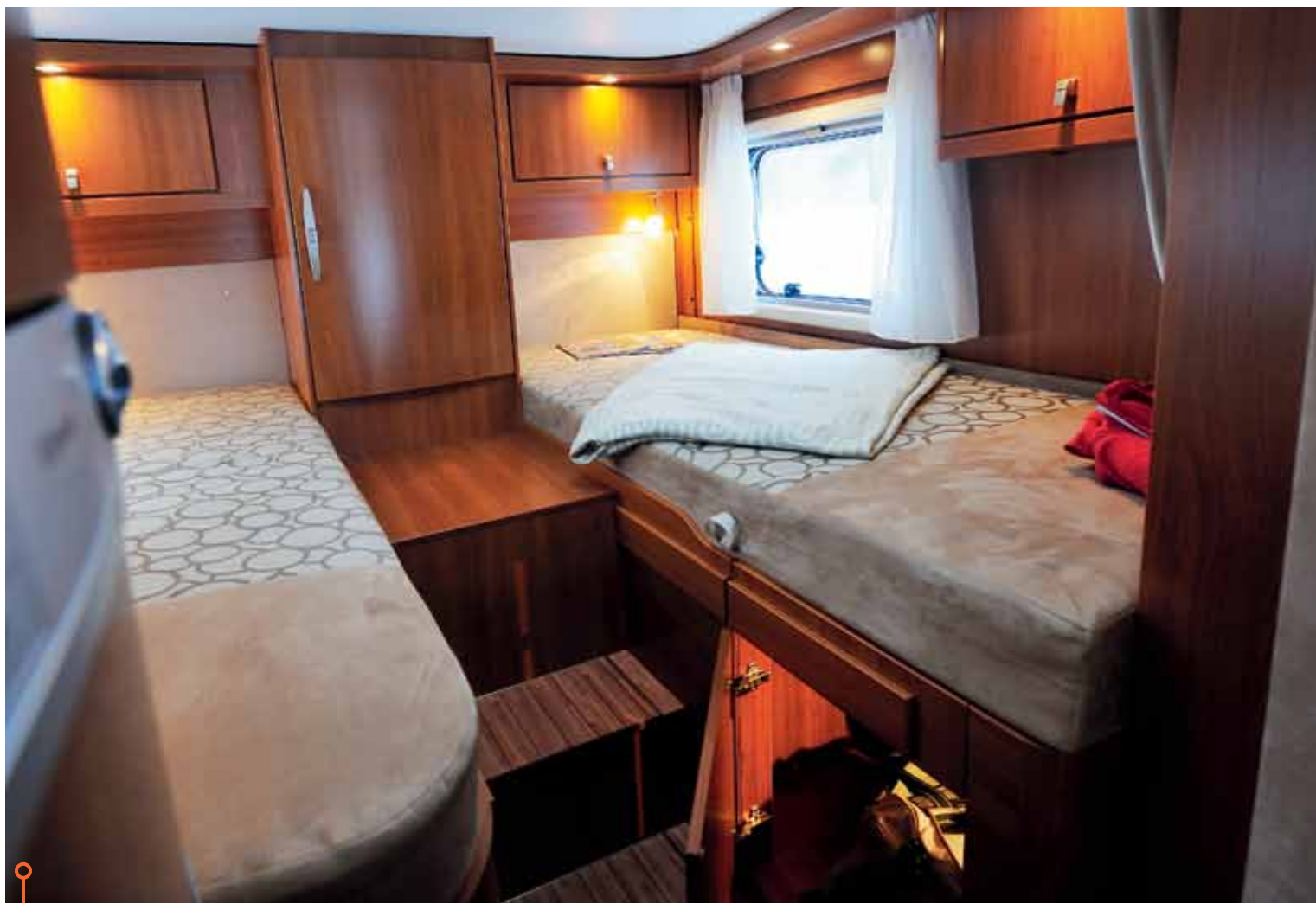
Ett sovrum som också innehåller förvaringsskåp över, mellan och under sängarna.