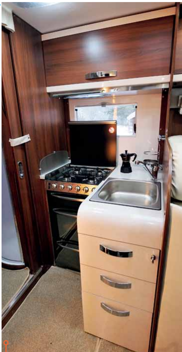
Form och funktion i bra förening i McLouis.