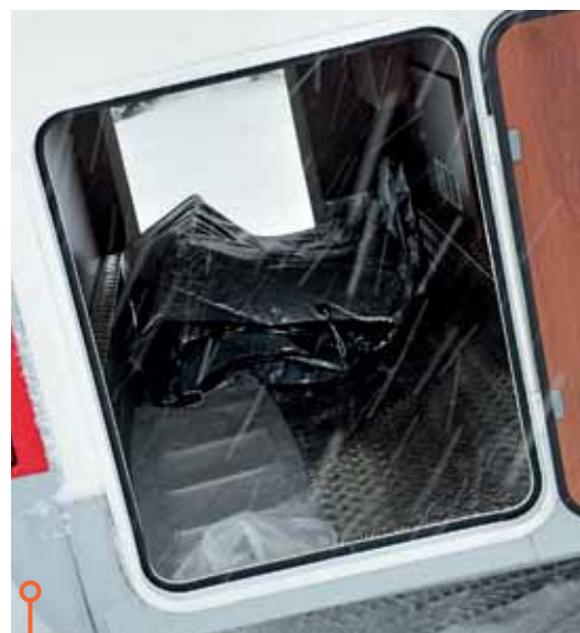
McLouis har det minsta utrymmet och saknar surringsanordningar för lasten.