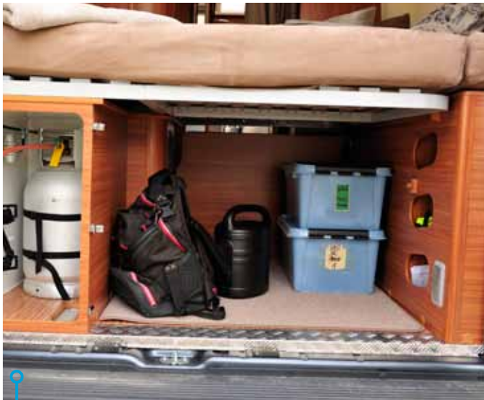
Adria har små smarta fack lättåtkomliga bakifrån. Fiffig plats för till exempel verktyg för lampbyte, eller ett par handskar.