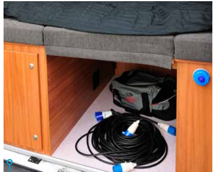
Lika stort utrymme och väldigt lätt att omvandla till ett gigantiskt bagagerum. Lyft och vik undan mittdynan bara.