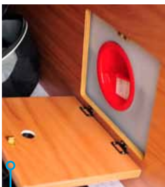
En vattentank man inte kan tömma förrän den är - nästan tom!

VÄRMEN KOMMER i bägge bilarna från Truma Combi 4, vilket betyder varm luft och varmt vatten till kranarna. Det betyder också att ingen av dem har elpatron vilket gör att man inte kan få värme via el. Golvvärme finns inte heller i någon av bilarna. Bägge har sex öppningsbara fönster och två takfönster. I tvättrummet sitter ett väggfönster i Adria bilen, i Weinsberg finns i stället en taklucka. Adria har störst vattenförråd, 100 liter färskvatten och 90 liter avloppstank, Weinsberg har 80 respek-