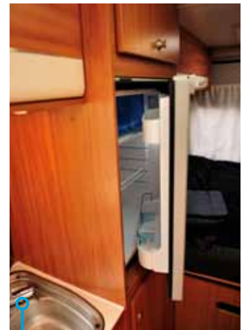
12V-skåp kan man ha igång även i miljöer där gasol är förbjudet.

»Det är av naturliga skäl trångt mellan kök och soffa i bilar av den här typen. Trångt dock i Adria.«