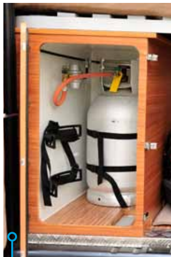
SecuMotion (slangbrottsventil) finns på bägge bilarna, här syns den i Adria Twin.

» Ronden är oavgjord och inte mycket att yvas över. SecuMotion (slangbrottsventil) som finns i bägge bilarna krävs för att man skall få ha gasolanläggningen i drift under färd.