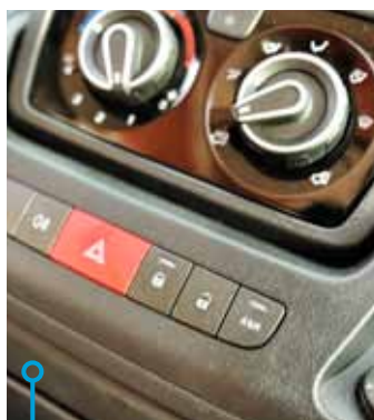
I Weinsbergs instrument hittar vi ASR/ESP.