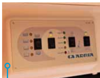
Manöverpanel med information om batteri- respektive vattenstatus.

trappa, liksom den lilla plåtfläppen i skjutdörren som gör att man i Adria kan ställa dörren i halvöppet läge och skydda spisen från vind, gör ändå att Adria vinner den här rondan. Det tas igen i prissättningen men det blir ändå en poäng mindre, för trappan och för ytterbelysningen. Dessutom finns det gardiner med myggnät även på bakrutorna i Adria.