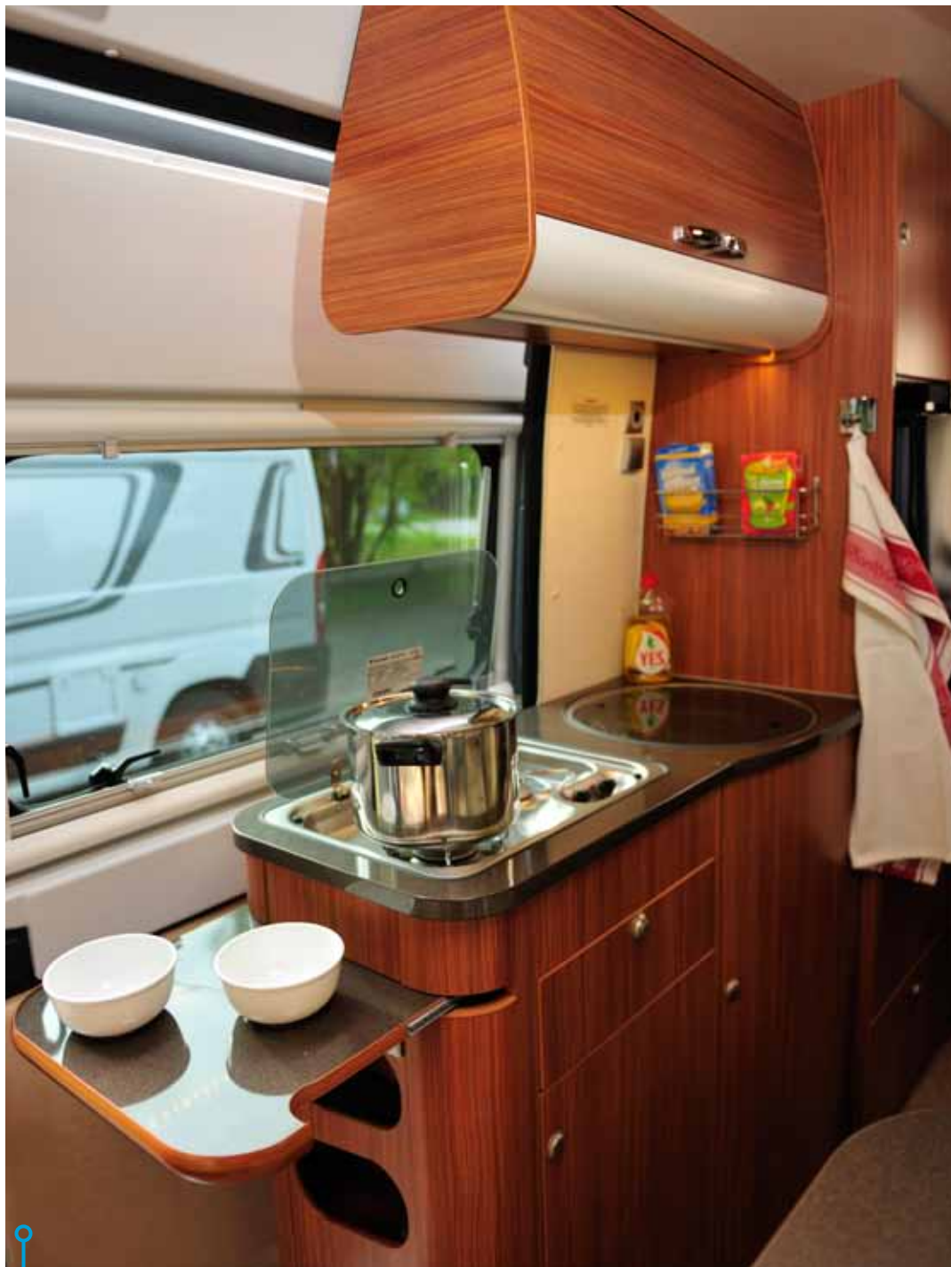
Adrias kök saknar riktiga avställningsytor men har ett par extra utrymmen under och över kylan.