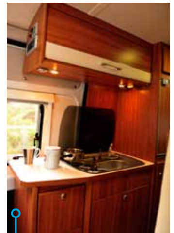
Weinsbergs kök har lådor och avställningsyta.