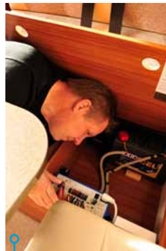
För att se 230V-säkringarna måste man krypa långt ner i sofflådan i Adria.

»En spegel eller ett akrobatiskt anlag klarar den saken men den kan monteras betydligt bättre, så att man ser utan att behöva stå på händerna.«