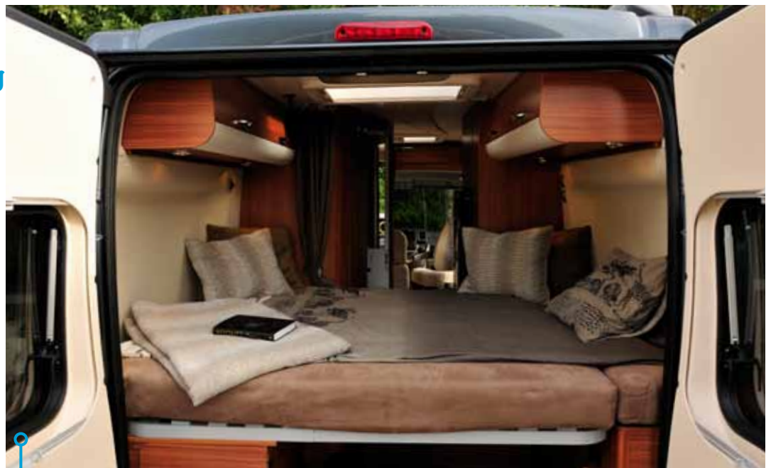
Adrias säng ger valfrihet när man skall välja åt vilket håll man vill ligga. Läslampor i bägge ändar.