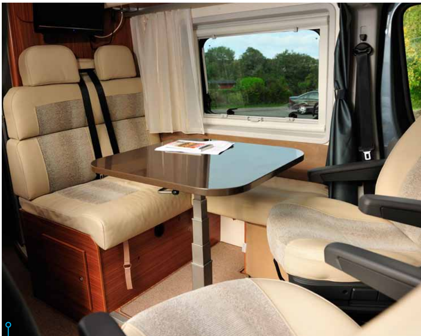
Sittgruppen i Adria går att omvandla till en extra säng, vinkelfoffan är mest för syns skull, och bäddningens.