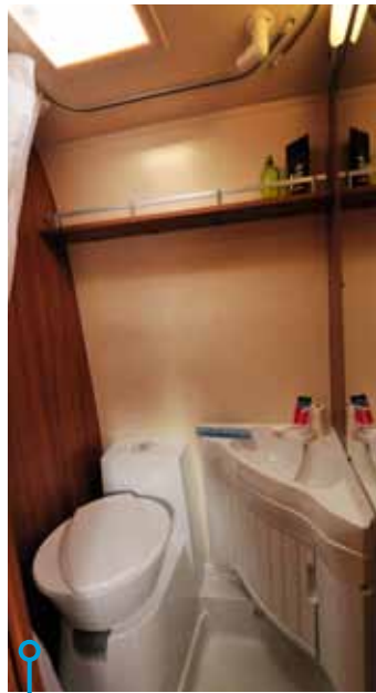
Takluckan gör vädrandet effektivt och väggen lämplig för handdukskrokar.