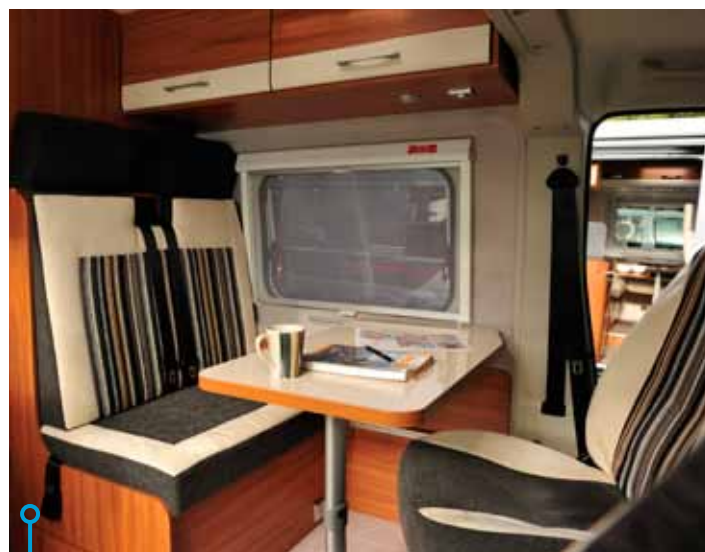
Större bord i Weinsberg men inte skönare eller bättre sittplatser. Vinkeln på ryggstödet är alltför upprätt.

» Hur vi än vrider och vänder kan vi inte undgå fakta – mysfaktorn är låg hos dem båda. Hur svårt kan det vara med ergonomiska säten?