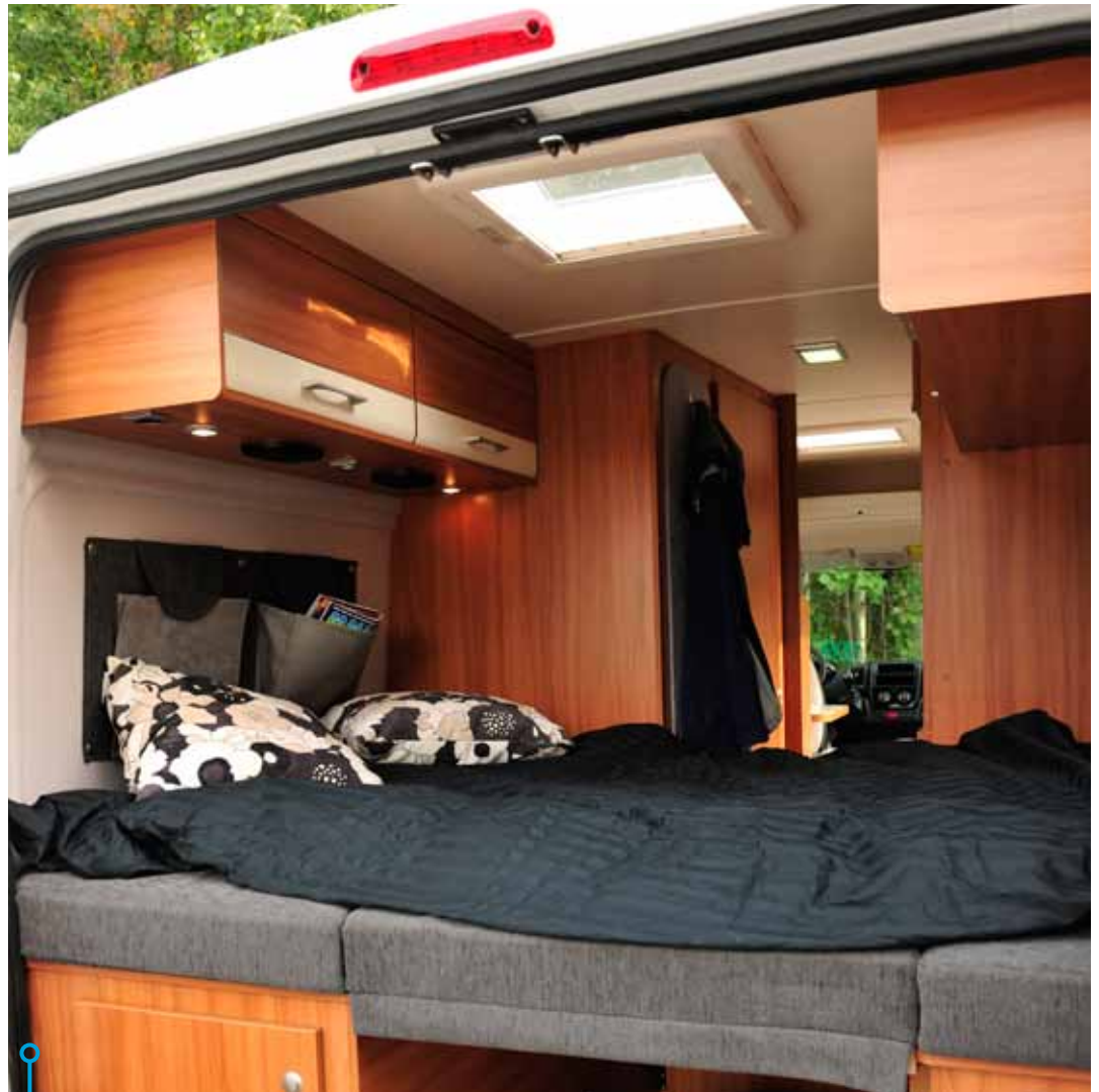
Weinsberg har läslampor, men bara i ena ändan.

» Sammanfattning: 19 centimeter bredare, 3 centimeter längre, bättre komfort med en madrass i ett stycke samt ett tygskynke som avskiljare till bodelen. Inget snack om att extrapoängen går till Adria.