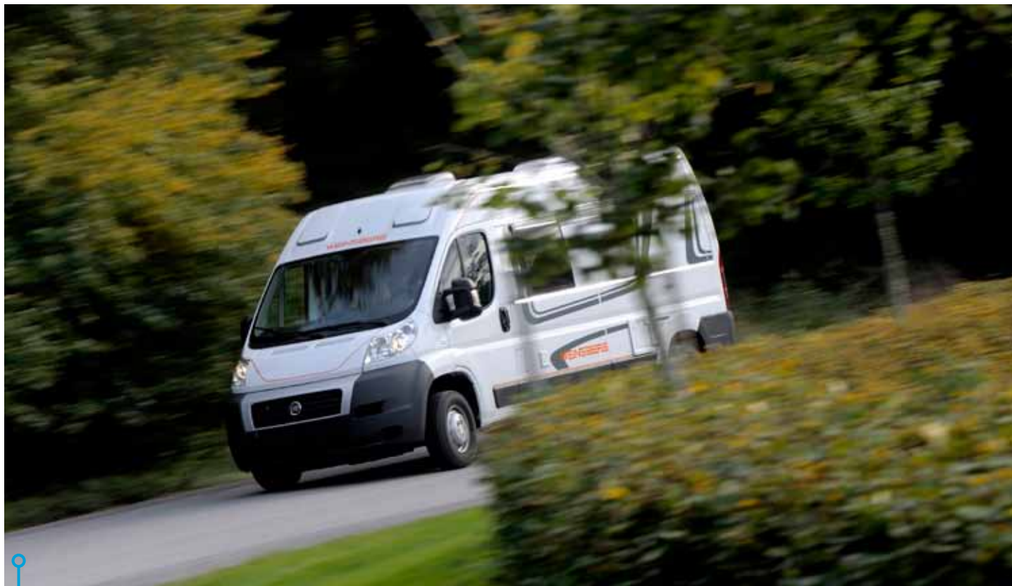
Snabba smidiga bilar som slinker fram genom skilda trafikmiljöer likt illrar i ett stenröse. Allt går rasande smidigt.