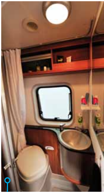
Adrias tvättrum har mer hyllor men vägg- i stället för takfönster.